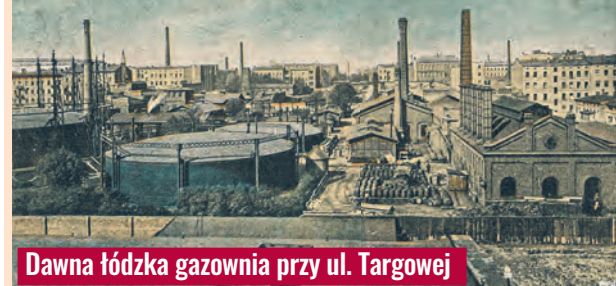
Dawna łódzka gazownia przy ul. Targowej

Pisaliśmy ostatnio o pierwszym oświetleniu łódzkich ulic latarniami gazowymi, które latem świeciły od 21:30 do 00:45, a zimą – od 18:00 do 2:00. Na skrzyżowaniach ul. Piotrkowskiej paliły się całą noc. Od 1870 r. zaczęto umieszczać latarnie także w przecznicach ul. Piotrkowskiej. Po dwie latarnie otrzymały ulice Zawadzka (Próchnika), Cegielniana (Jaracza), Krótka (Traugutta) i Nawrót. W 1886 r. było już w Łodzi 467 latarni. W 1891 r. działały 643 uliczne latarnie gazowe i 10 kandelabrow na placach oraz przed kościołami. W latach 80. XIX w. fabrykanci łódzcy zaczęli wprowadzać oświetlenie gazowe w swoich przedsiębiorstwach. Karol Scheibler miał już wówczas własną gazownię do oświetlenia fabryki na Księżym Młynie. Inne zakłady korzystały