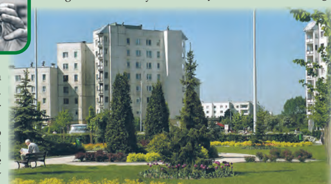
Nowoczesne, jak na czasy końca PRL, osiedle mieszkaniowe Radogoszcz Wschód

ki architekt ma koncie również m.in. modernizacje Teatru im. Jaracza, Urzędu Marszałkowskiego, budynku Wydziału Komunikacji UMŁ oraz projekt miejskiej hali sportowej w parku 3 Maja. Jakub Wujek zmarł 9 lutego 2014 r. w Łodzi, został pochowany w Alei Zasłużonych na Cmentarzu Komunalnym Doły. agr