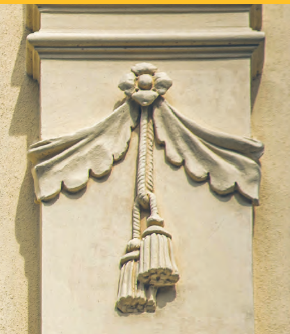
Detal architektoniczny eklektycznej kamienicy przy ul. Nawrot 2a