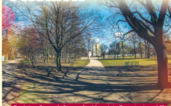
Park im. Szarych Szeregów (dawniej „Promienistych”)

Idzie wiosna, więc warto zacząć spacerować po łódzkich parkach. Zachowały się nazwy niektórych z nich, jak np. Helenów, inne wyszły z użycia, jak dawniejsza Kwela, czyli park Źródlika, albo zostały zmienione. I tak było w przypadku parku im. „Promienistych”, zwanym potocznie „Promykiem”, który w maju 1994 r. otrzymał nową nazwę – parku im. Szarych Szeregów. Ten zielony teren na osiedlu Doły, położony pomiędzy ulicami: Głowackiego, Staszica, Plater, Górniczą, o pow. 15 ha powstał w latach 1961–1964 wg projektu K. Chrabelskiego i obejmo-