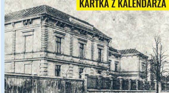
Szpital miejski św. Aleksandra w 1912 r. przy pl. Katedralnym, obecnie seminarium duchowne