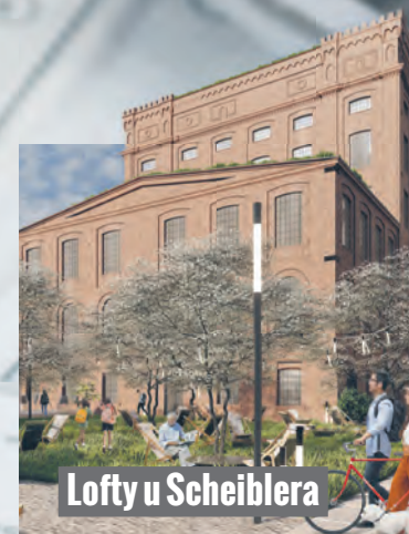
Lofty u Scheiblera