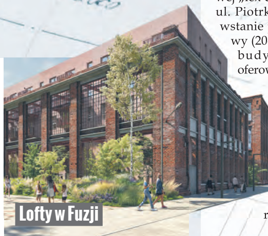
Lofty w Fuzji