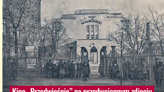
Kino „Przedwiosnie” na przedwojennym zdjęciu

Chodzi o łódzkie kino „Przedwiosnie”, mieszczące się przy ul. Żeromskiego 74/76, które zakończyło swoją działalność na początku tego stulecia i znane jest raczej starszej publiczności, zwłaszcza z lat 70. XX w. Zapewne nie wszyscy wiedzą, że kino to zostało założone jeszcze przed wojną, w 1929 r. przez Zrzeszenie Majstrów Fabrycznych i generalnie miało... pecha. W latach 30. XX w. popadło w kłopoty finansowe, jednak udało się je uratować przed bankrutem. Zaraz po wojnie, posiadający salę kinową