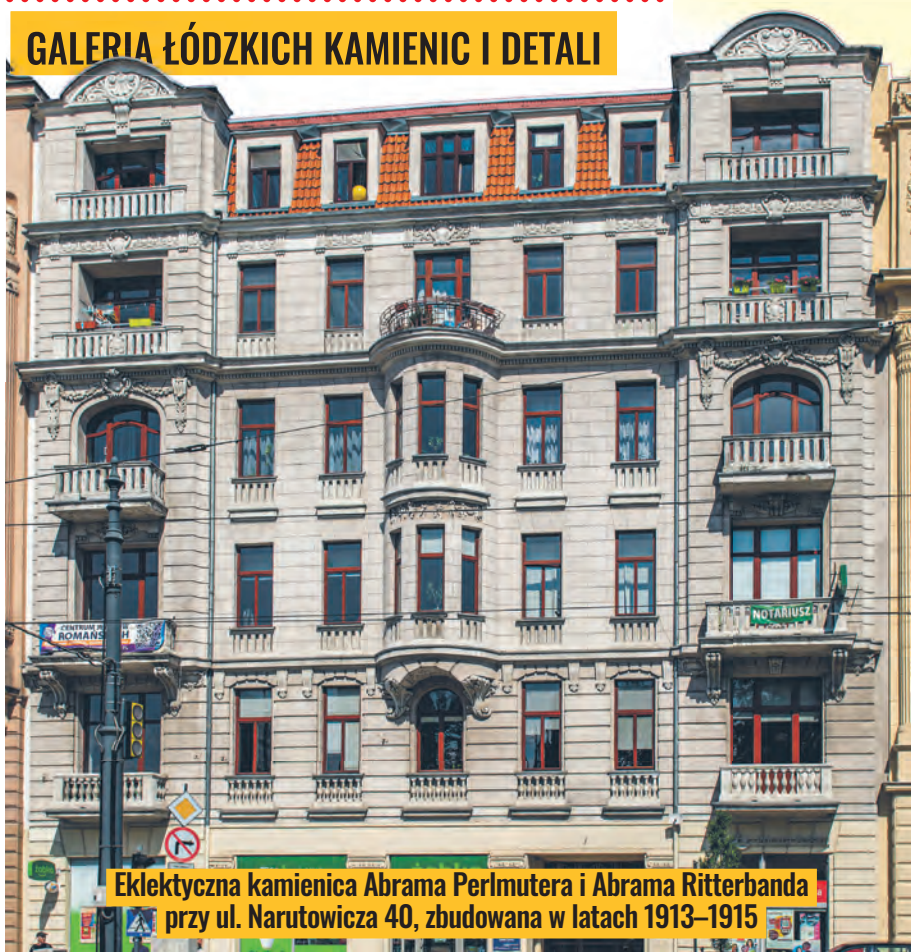
Ekлекtyczna kamienica Abrama Perlmuttera i Abrama Ritterbanda przy ul. Narutowicza 40, zbudowana w latach 1913–1915

ŁÓDŹ.pl DLA SENIORA | DLA RODZIN | DLA KOCHAJĄCYCH ŁÓDŹ