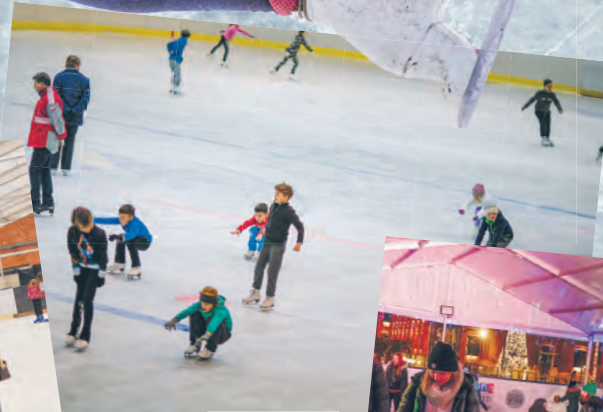
Lodowisko „Bombonierka” przy ul. Stefanowskiego