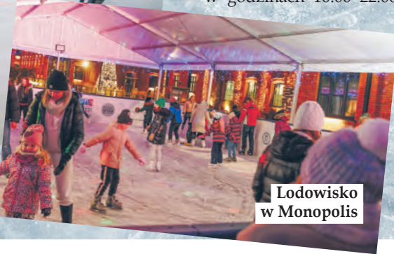
Lodowisko w Monopolis