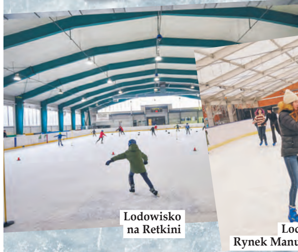
Lodowisko na Retkini