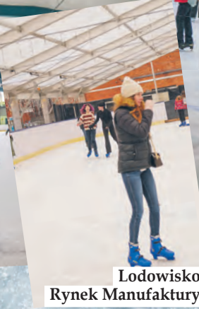
Lodowisko Rynek Manufaktury