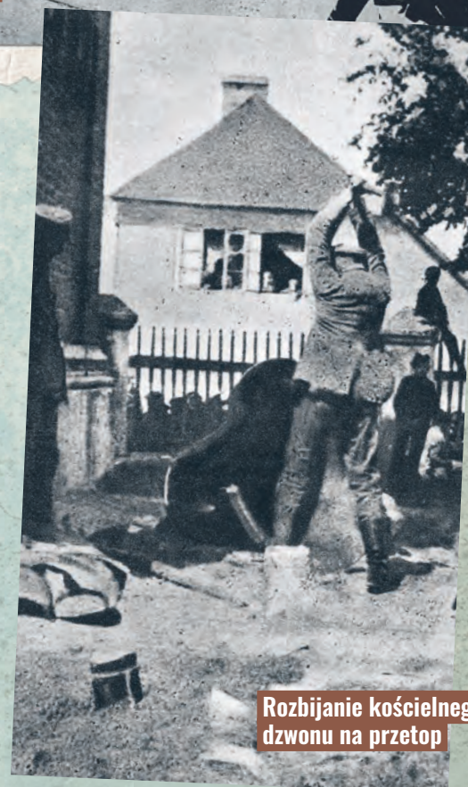
Rozbijanie kościelnego dzwonu na przetop