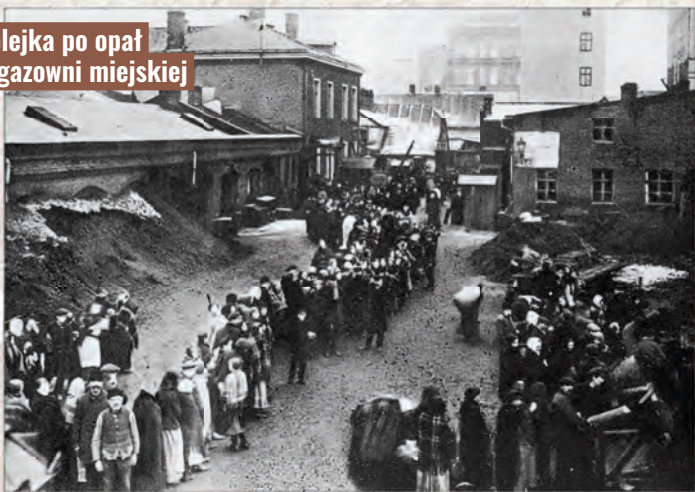
Kolejka po opał w gazowni miejskiej

Trudności dotknęły również Towarzystwo Kredytowe Miejskie, które na początku 1916 r. miało w kasie 800 tys. rubli, a zaległości wynosiły 8 mln rubli. Już w marcu 1915 r. praktycznie wyczerpały się też możliwości finansowe władz miejskich.