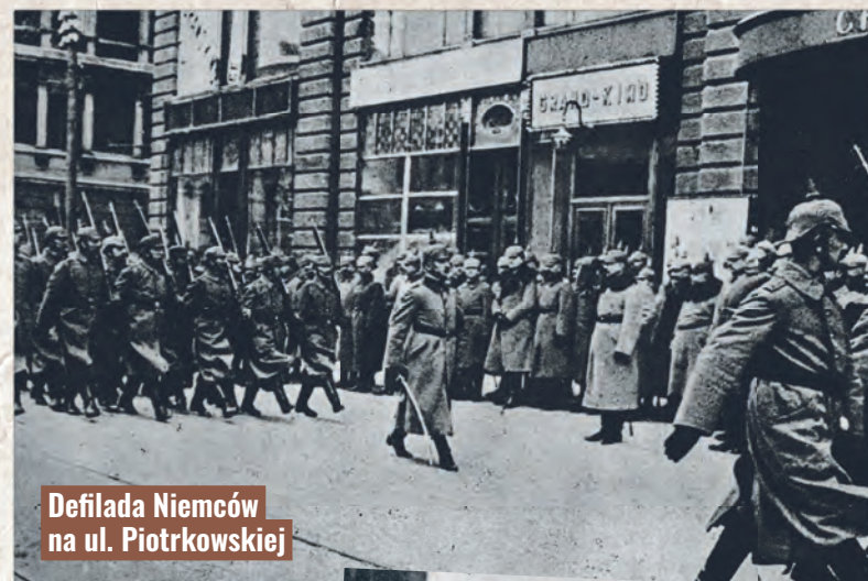
Defilada Niemców na ul. Piotrkowskiej