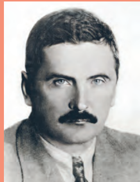
Dowódca AK w latach 1942 – 1943 – gen. Stefan Rowecki „Grot” na fotografii z czasów okupacji