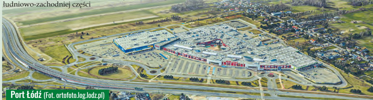
Port Łódź

ria Łódzka w śródmieściu, M1 na wschodnich obrzeżach oraz Pasaż Łódzki przy al. Jana Pawła II i szykująca się do ponownego otwarcia Sukcesja przy al. Politechniki stanowią spory potencjał handlowy i wyznaczają zakupową mapę dla łódzian już w kolejnym pokoleniu. Przypomnijmy, że Manufakturę otwarto 18 lat temu, a pierwszy w Łodzi hipermarket, czyli Carrefour na Chojnach, uruchomiono w 1997 r. agr