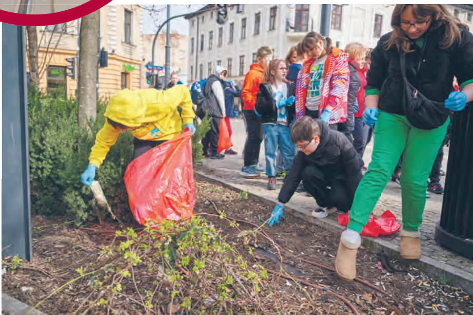
Galante Sprzątanie 2024! Przez cztery wiosenne dni tódzianie wspólnie porządkowali Łódź. Już po raz trzeci udowadniają, że wspólna praca i zaangażowanie przynoszą wspaniałe efekty.