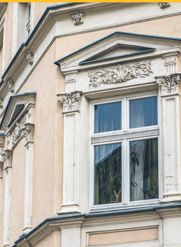
Detale architektoniczne na fasadzie kamienicy przy ul. Radwańskiej 31

ŁÓDŹ.pl DŁA SIEDMIA | DŁA BRODZI | DŁA KOCHAJĄCYCH ŁÓDŹ