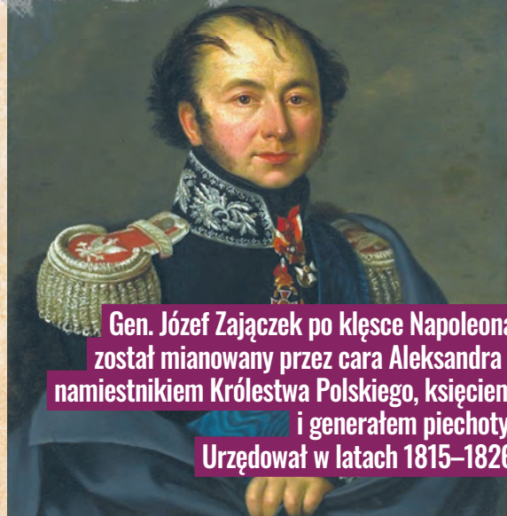
Gen. Józef Zajączek po klęsce Napoleona został mianowany przez cara Aleksandra I namiestnikiem Królestwa Polskiego, księciem i generałem piechoty. Urzędował w latach 1815–1826