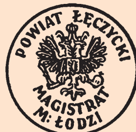
Pieczęć m. Łodzi z 1842 r.