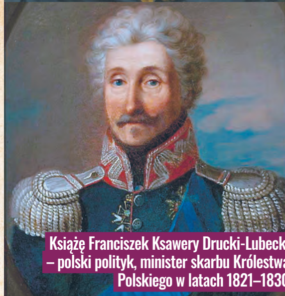
Książę Franciszek Ksawery Drucki-Lubecki – polski polityk, minister skarbu Królestwa Polskiego w latach 1821–1830

W raporcie z lipca 1820 r. Rajmund RembIELIŃSKI zanotował: „(...) Udałem się do miasta Łodzi, równie jak Zgierz na tymże samym trakcie piotrkowskim, lecz nad inną rzeką, także wśród borów położonego: przez to zarobkowem stać się może miejscem. Przed trzema jeszcze laty wezbrawszy woda w rzece tamtejszej zniosta zupełnie młyn rządowy z upustem, który pod samym stał miastem, można by w tem miejscu dobry wybudować folusz, cegielnię wystawić i budującym się rękodzielnikom z bliskiego boru rządowego, który tam żadnej nie ma ceny, drzewa bezpłatnie udzielić (...)”.