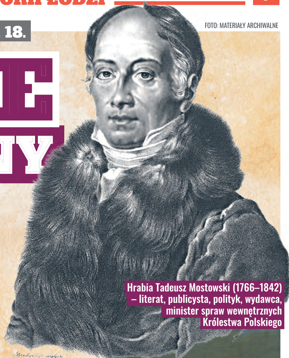
Hrabia Tadeusz Mostowski (1766–1842) – literat, publicysta, polityk, wydawca, minister spraw wewnętrznych Królestwa Polskiego

Warto przypomnieć, że pierwsze projekty przekształcenia Łodzi w ośrodek przemysłowy wyszły z kręgów miejscowego społeczeństwa, o czym już w 1815 r. pisał do władz zwierzchnich łódzki burmistrz, Szymon Szczawiński. Jednak namiestnik Zajączek wydał wiążące postanowienia dopiero 18 września 1820 r., po zapoznaniu się z wynikami wizytacji RembIELIŃSKIEGO, który objechał konno te rejony w lipcu 1820 r. W Królestwie Polskim, poza staropolskim okręgiem przemysłowym, dominowało rolnictwo. Szczególnie wyraźny stał się jednak brak sukna i płótna, czego przyczyną było oddzielenie od dawnego wielkopolskiego okręgu włókienniczego, który zajęły Prusy. Niewielka produkcja, przeważnie skupiona na wsi, nie mogła zaspokoić rosnącego popytu na wyroby włókiennicze. Obok potrzeb wewnętrznych ze strony ludności i wojska ważnymi czynnikami były rosnące możliwości eksportowe wszelkich towarów tekstylnych na ogromny rynek Cesarstwa Rosyjskiego, szczególnie po wprowadzeniu w 1821 r. ochronnej taryfy celnej, a także zniesienie przywileju dla Prus przewozu sukna do Chin.