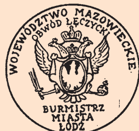
Pieczęć m. Łodzi z 1826 r.

germanna, który kierował miastem przez kilkanaście lat w dynamicznym okresie transformacji gospodarczej.