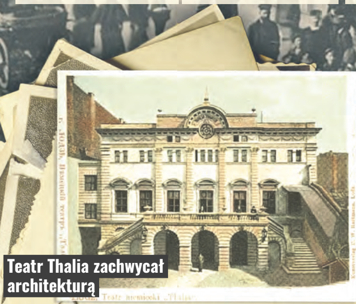
Teatr Thalia zachwycał architekturą