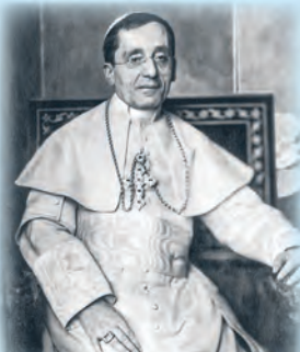
Papież Benedykt XV