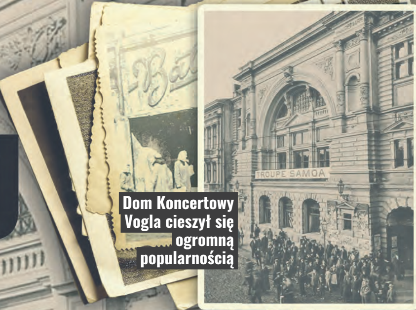
Dom Koncertowy Vogla cieszył się ogromną popularnością

W latach powojennych kino zmieniło nazwę na Bałtyk i ta została z nim najdłużej. Remont w 1967 r. uczynił je najnowocześniejszym kinem w Polsce. Jako pierwsze w Łodzi dostało też ekran panoramiczny. Wcześniej nie było tak różowo. W wywiadzie udzielonym „Dziennikowi Łódzkiemu” w 1957 r. dyrektor musiał tłumaczyć się z braku wspomnianego ekranu. Autor artykułu narzekał zaś, że „w wielu miastach Polski od dawna już uruchomiono kino panoramiczne, w Łodzi sprawa ta ciągnie się od dwóch lat bez ostatecznego zrealizowania”.