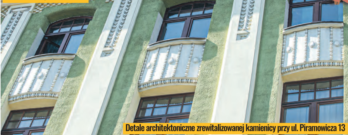
Detale architektoniczne zrewitalizowanej kamienicy przy ul. Piramowicza 13