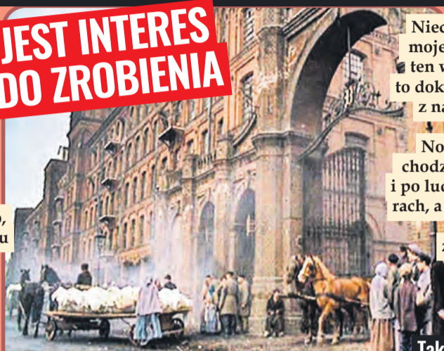
Tak prezentowały się zakłady Poltex w filmowym kadrze „Ziemi obiecanej”

Niech mi pan wierzy, moje słowo to nie jest ten wiatr, moje słowo to dokument, to weksel z najlepszym żyrem.