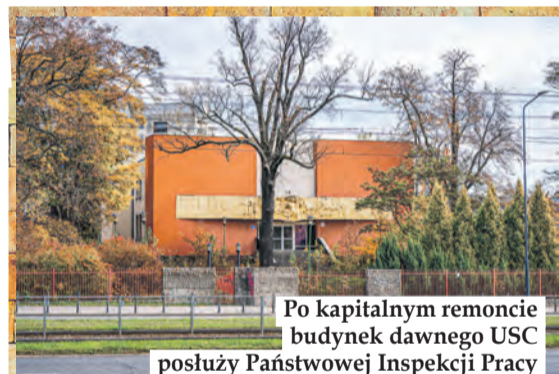
Po kapitalnym remoncie budynek dawnego USC posłuży Państwowej Inspekcji Pracy