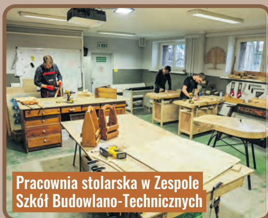
Pracownia stolarska w Zespole Szkół Budowlano-Technicznych