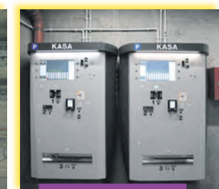
Kasy, w których można zapłacić nawet BLIK-iem