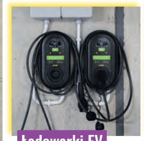
Ładowniki EV dla samochodów elektrycznych