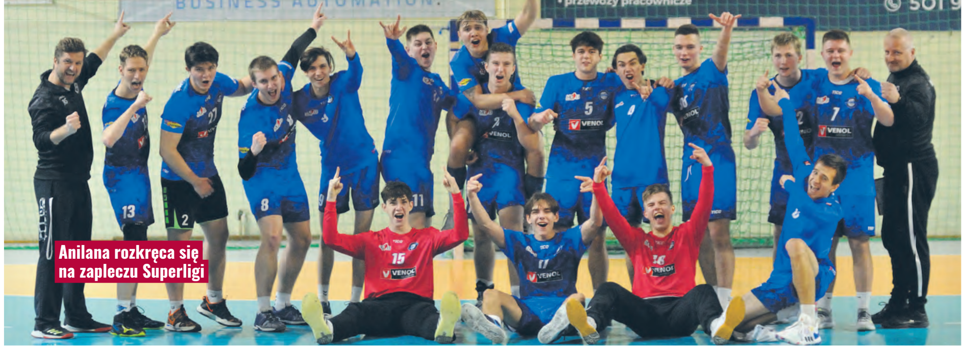
Anilana rozkręca się na zapleczu Superligi