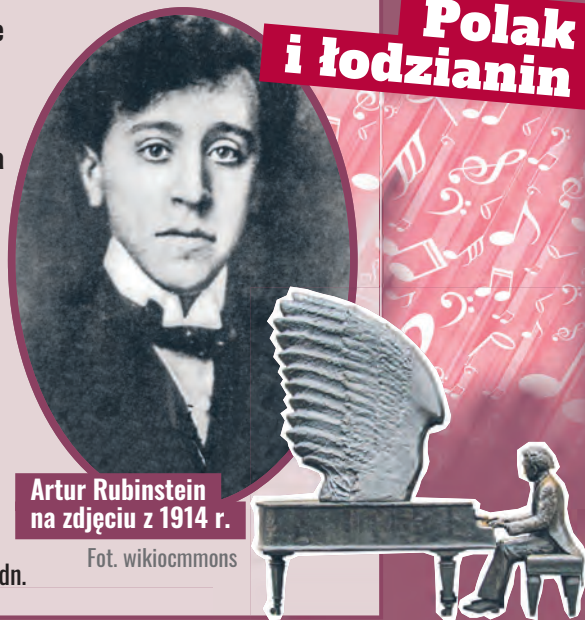
Artur Rubinstein na zdjęciu z 1914 r.

młodopolskie kompozycje Karola Szymanowskiego. Artysta miał już ugruntowaną międzynarodową pozycję towarzyską, która była istotnym elementem jego wizerunku. Zdobywał sympatię i uznanie publiczności nie tylko wspaniałą grą – ujmował też osobowością, inteligencją, dowcipem, ciepłem i pogodą ducha. O Polsce mówił: „To mój kraj”, a Łódź zawsze wspominał z ogromnym sentymentem. agr cdn.