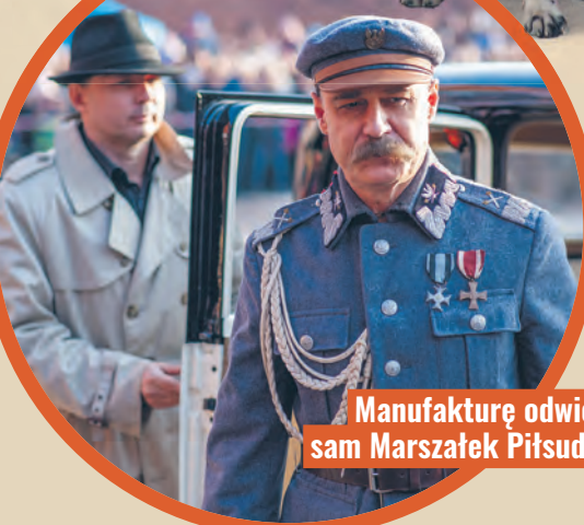
Manufakturę odwiedzi sam Marszałek Piłsudski!