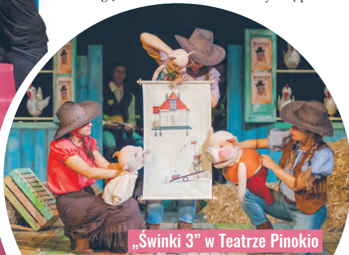
„Świnki 3” w Teatrze Pinokio