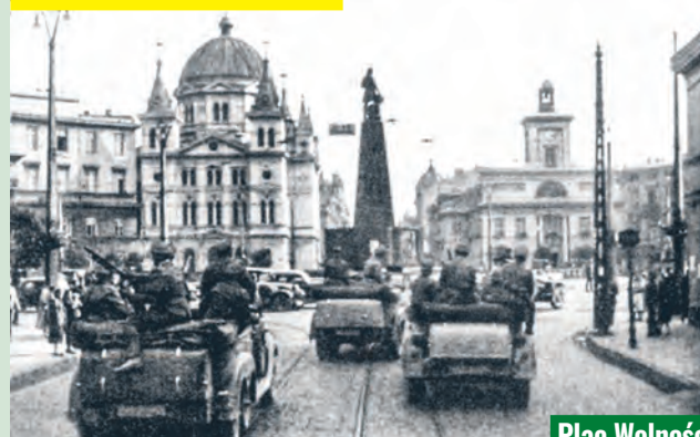
Plac Wolności w pierwszych dniach okupacji niemieckiej we wrześniu 1939 r.