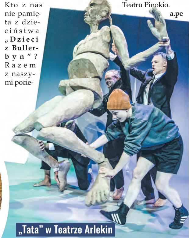
„Tata” w Teatrze Arlekin