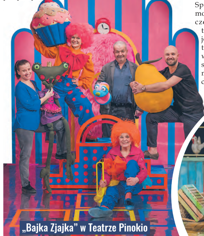
„Bajka Zjajka” w Teatrze Pinokio