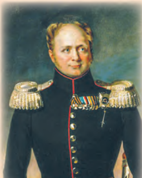
Car Aleksander I na obrazie G. Dawe (1826 r.)

Car Aleksander I, a właściwie cesarz Rosji w latach 1801–1825 i od 1815 r. także władca Królestwa Polskiego, bawiąc w Łodzi w 1825 r., wyraził wolę, aby istniejąca w mieście osada prządków i tkaczy została powiększona. Jeszcze w tymże roku przyłączono do miasta tereny wsi Wólka. Pozwoliło to budowniczym kontynuować regulację osady, gdyż na skutek wzrastającej imigracji tkaczy potrzebna była większa liczba placów. Inkorporacja Wólki, a właściwie wyrugowanie chłopów z tej wsi – nie bez rozpaczliwego oporu, o czym piszemy obok w rubryce kryminalnej – na skraj lasów Widzewa i Zarzewa, stworzyła możliwość swobodnego operowa-