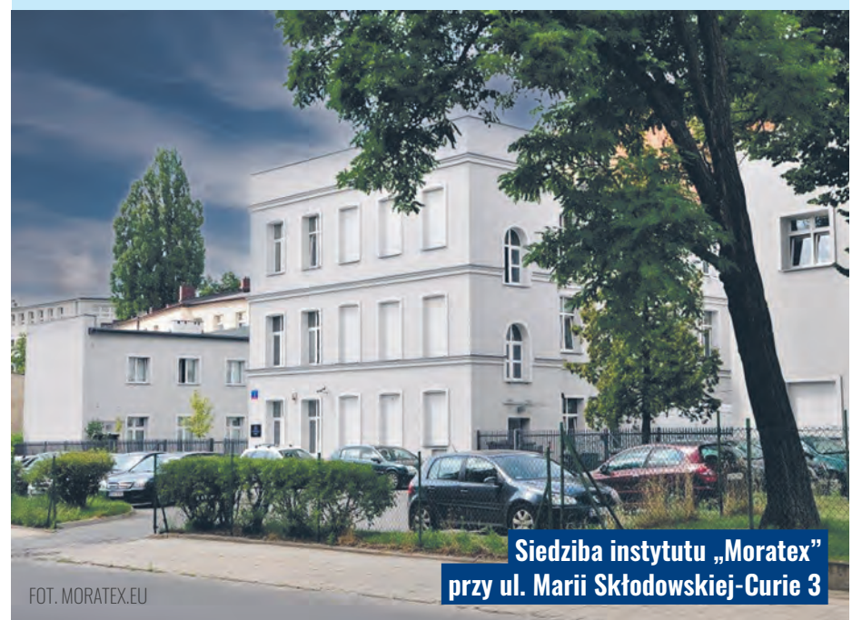
Siedziba instytutu „Moratex” przy ul. Marii Skłodowskiej-Curie 3