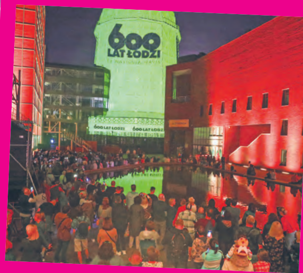
Świetlne pokazy w EC1