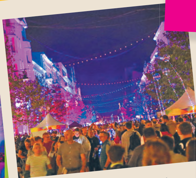
Tysiące ludzi na królowej ulic