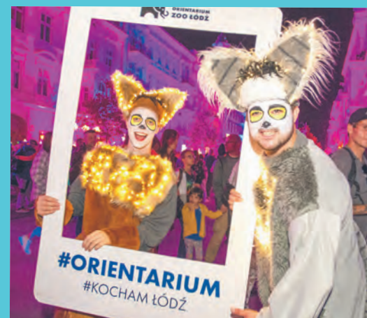
Goście z Orientarium Zoo Łódź