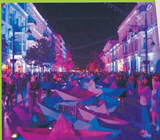
Papierowe łódeczki na Piotrkowskiej