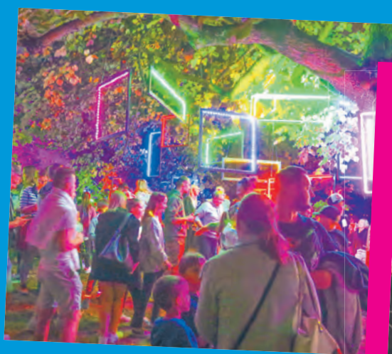
Rozświetlony park Sienkiewicza