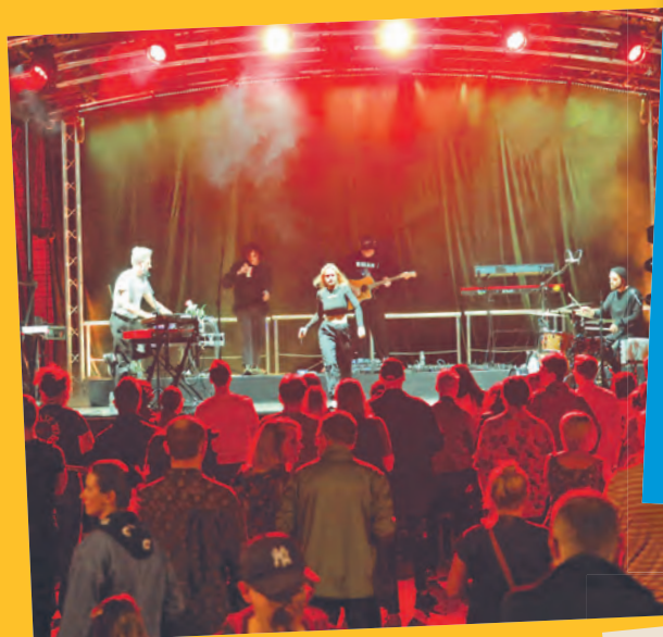
Koncerty w ramach Festiwalu Światła

Zakończony w niedzielę Festiwal Kinetycznej Sztuki Światła Light.Move.Festival po raz kolejny dowiódł, że pomimo kilkunastoletniej już historii imprezy niezmiennie pozostaje jednym z najpopularniejszych wydarzeń plenerowych odbywających się w Łodzi. Wielotysięczna publiczność, która cieszyła oczy mappingami i projekcjami na ścianach łódzkich budynków oraz instalacjami świetlnymi w parkach i innych zakamarkach śródmieścia dowodzi, że magia światła wciąż zachwyca.