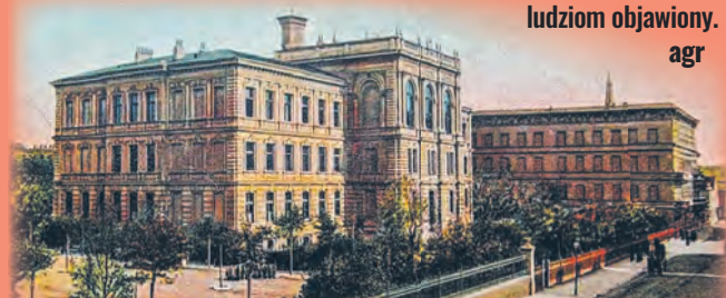
Gimnazjum Męskie im. J. Piłsudskiego na starej pocztówce