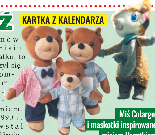
Miś Colargol i maskotki inspirowane misiem Uszatkiem

Szlak bajkowy w Łodzi powstaje od kilkunastu lat, a pierwszą rzeźbą była stojąca przy ul. Piotrkowskiej 87 figura misia Uszatka, który stał się niemal symbolem naszego miasta. Do tej misiowej kompanii trzeba jeszcze doliczyć szereg filmów o przygodach Colargola (rzeźba stoi na skwerze z placem zabaw przy ul. Sienkiewi-