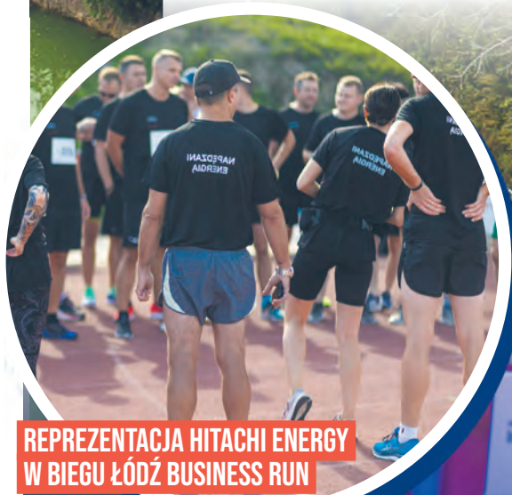
REPREZENTACJA HITACHI ENERGY W BIEGU ŁÓDŹ BUSINESS RUN

Nie chodzi tu jednak tylko o rozwój zawodowy, ale też dobrostan – pracownicy korzystają z programów wsparcia zdrowia, takich jak spotkania z fizjoterapeutą na terenie zakładu, a pracę w firmie chętnie wykorzystują, aby działać przy okazji na rzecz lokalnej społeczności. Dzięki temu każdy może mieć poczucie, że jego praca rzeczywiście ma znaczenie. Może to właśnie powód, dla którego niektóre rodziny pracują tu już od pokoleń.