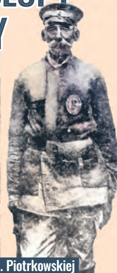
Widok ul. Piotrkowskiej i postanec miejski z pocz. XX w.