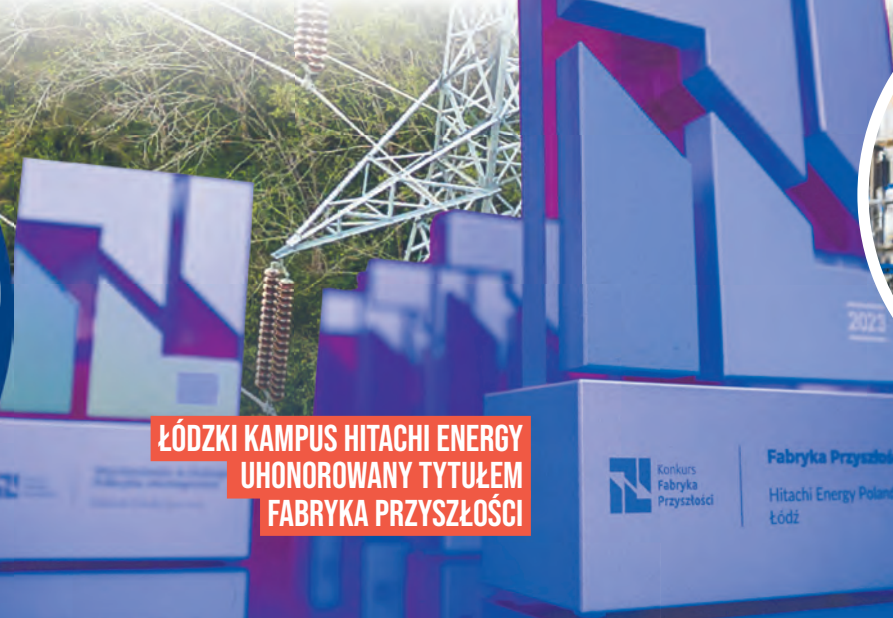
ŁÓDZKI KAMPUS HITACHI ENERGY UHONOROWANY TYTUŁEM FABRYKA PRZYSZŁOŚCI