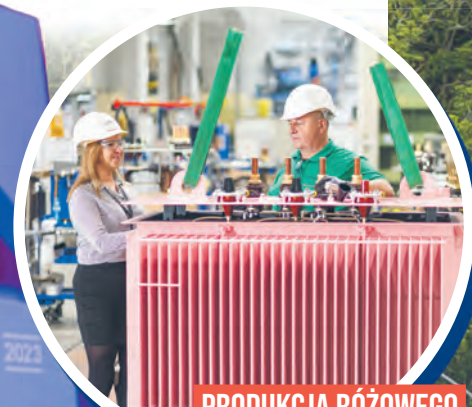
PRODUKCJA RÓŻOWEGO TRANSFORMATORA WSPARŁA ŁÓDZKIE STOWARZYSZENIE POMAGAJĄCE WALCZYĆ Z RAKIEM PIERSI

CHCESZ STAĆ SIĘ CZĘŚCIĄ ZESPOŁU, KTÓRY KAŻDEGO DNIA ZMIENIA OBlicze ENERGETYKI?