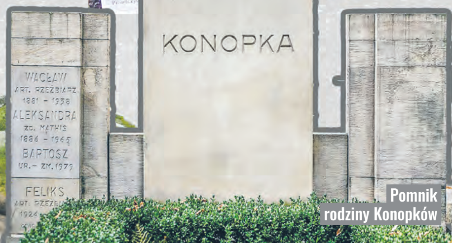
Pomnik rodziny Konopków