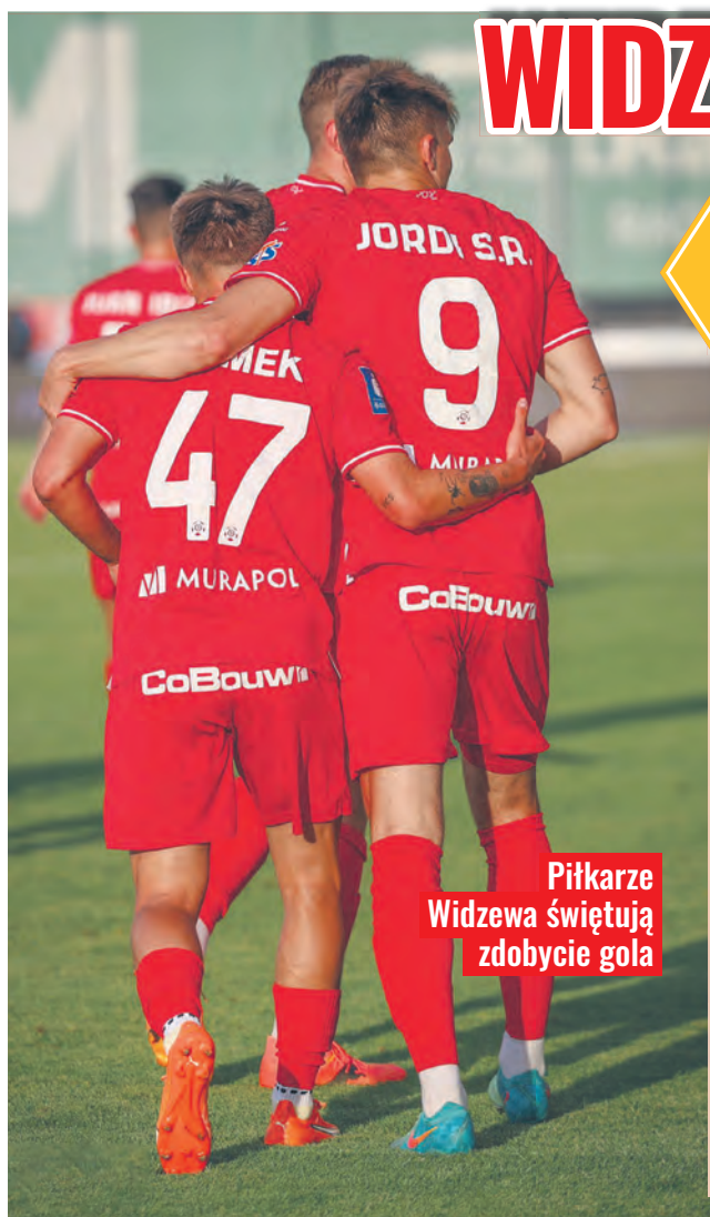
Piłkarze Widzewa świętują zdobycie gola