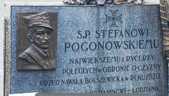
Pomnik Stefana Pogonowskiego