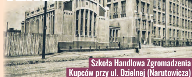
Szkoła Handlowa Zgromadzenia Kupców przy ul. Dzielnej (Narutowicza)