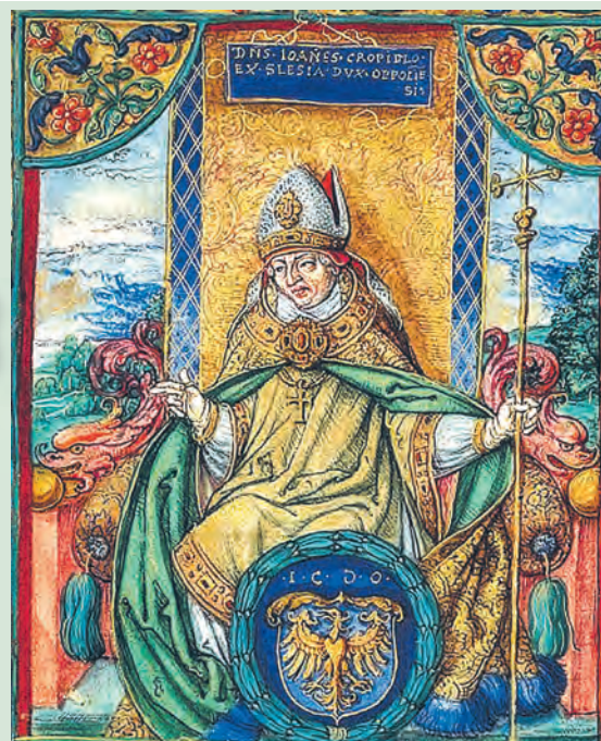
Biskup włocławski Jan Kropidło, zwany tak z powodu bujnej czupryny

wartym w przywileju księcia łęczyckiego i dobrzyńskiego Władysława z 6 września 1332 r. Książę zwolnił wówczas 14 wsi na ziemi łęczyckiej i ich ludność, w tym także Łódź, należących do biskupstwa włocławskiego od wszelkich opłat, podatków, usług i innych ciężarów oraz od sądów książęcych. Odtąd mieszkańcy mieli odpowiadać jedynie przed swoim panem lub jego sołtysami i włodarzami, a ponadto biskup otrzymał pozwolenie przeniesienia