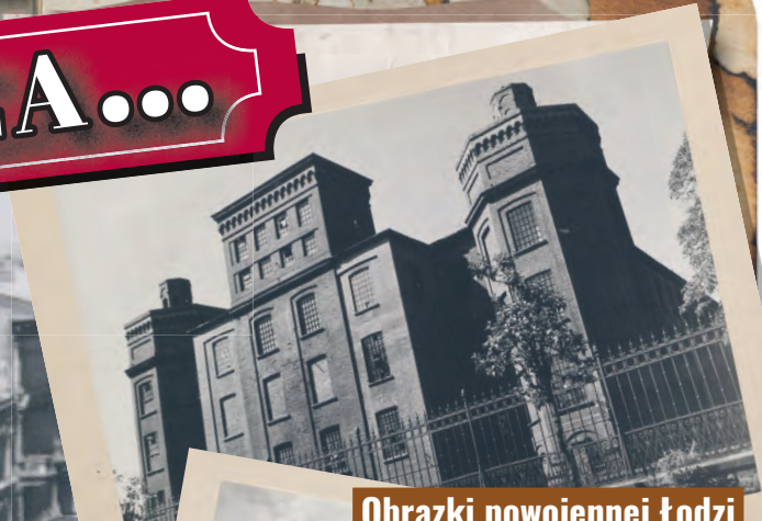
Obrazki powojennej Łodzi

W Łodzi ruszyło po wojnie aż 10 zespołów teatralnych – Teatr Wojska Polskiego objął Leon Schiller, Teatr Kameralny prowadził Erwin Axer. Powstały inne sceny: TUR, Gong, Lutnia, Syrena i kilka zespołów lalkowych. O znaczeniu Łodzi w pierwszych miesiącach po wojnie może