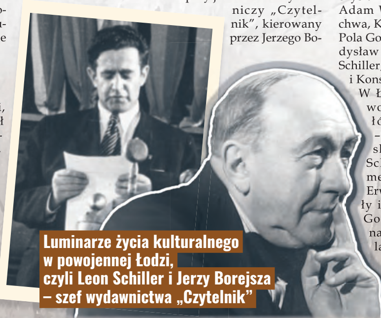
Luminarze życia kulturalnego w powojennej Łodzi, czyli Leon Schiller i Jerzy Borejsza – szef wydawnictwa „Czytelnik”