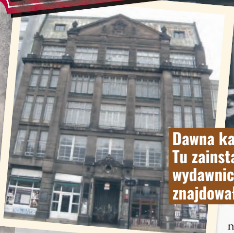
Dawna kamienica Siemens przy ul. Piotrkowskiej 96. Tu zainstalował się pierwszy w nowej Polsce koncern wydawniczy. Przez kolejne 40 lat w tym budynku znajdowały się redakcje łódzkich gazet

Na krótki czas Łódź stała się nieformalną stolicą kraju, pełniąc rolę ośrodka odradzającego się życia kulturalnego. Mieszkania i lokale w ocalałych kamienicach przyciągały do naszego miasta rozmaite instytucje, organizacje, struktury nowej władzy. Przyjechało tu wielu ludzi nauki i sztuki, którzy pragnęli rozpocząć nowy etap.