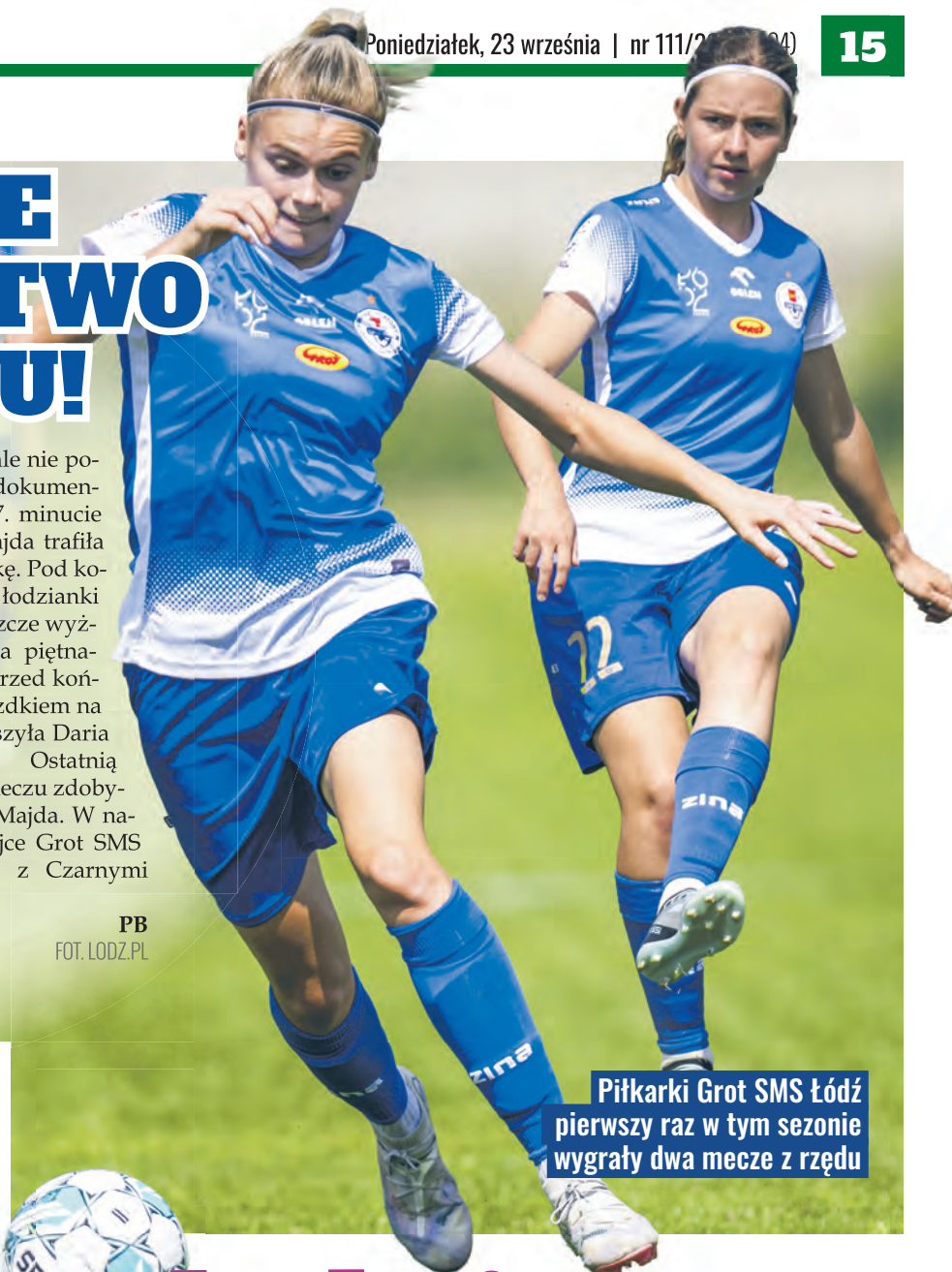
Piłkarki Grot SMS Łódź pierwszy raz w tym sezonie wygrały dwa mecze z rzędu