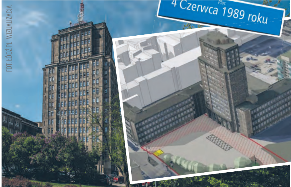
FOT. ŁÓDŹ.PL, WIZUALIZACJA