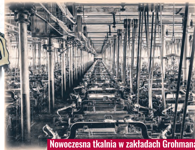
Nowoczesna tkalnia w zakładach Grohmana