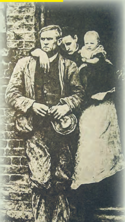
Łódzka rodzina w czasie lokautu („Tygodnik Ilustrowany”, 1907)