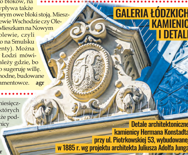
Detale architektoniczne kamienicy Hermana Konstadta przy ul. Piotrkowskiej 53, wybudowanej w 1885 r. wg projektu architekta Juliusza Adolfa Junga