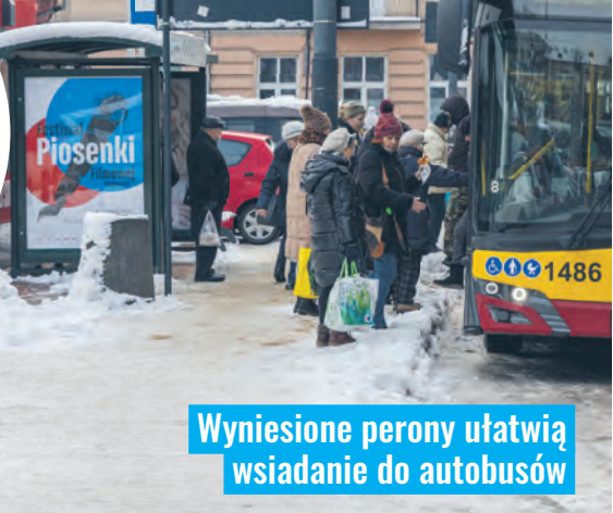
Wyniesione perony ułatwią wsiadanie do autobusów

przystankowy, umożliwiający wygodne wsiadanie i wysiadanie, zwłaszcza łódzkim seniorom i osobom z niepełnosprawnościami. WS