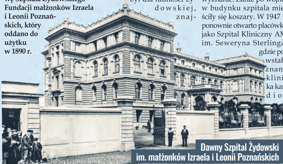
Dawny Szpital Żydowski im. małżonków Izraela i Leonii Poznańskich