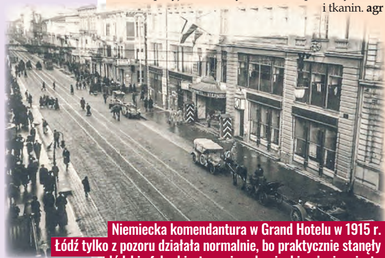
Niemiecka komendantura w Grand Hotelu w 1915 r. Łódź tylko z pozoru działała normalnie, bo praktycznie stanęły łódzkie fabryki, stanowiące krwioobieg życia miasta

przesłanie próbek wyrobów znajdujących się w magazynach. Zarządzenie dotyczyło przejęcia aż 80% towarów w formie rewizycji. W latach 1916–1918 władze niemieckie stosowały różnego typu formy zajęcia dóbr: rewizycje, zakup ogłaszany przez wojsko, przymusowy skup towarów przez urzędy centralne, wywłaszczenia i konfiskaty. Sekwestr towarów ogłoszono 15 marca 1916 r. w Warszawie, a w maju w Łodzi, wprowadził go w życie miejscowy urząd surowców wojennych oraz komisja rewizycji maszyn. Większość łódzkich przemysłowców w obawie przed wywłaszczeniem lub konfiskatą decydowała się na „dobrowolną” sprzedaż wyrobów, otrzymując w zamian kwity rewizycyjne. W 1916 r. przejęto większość zapasów surowców, półfabrykatów i tkanin. agr