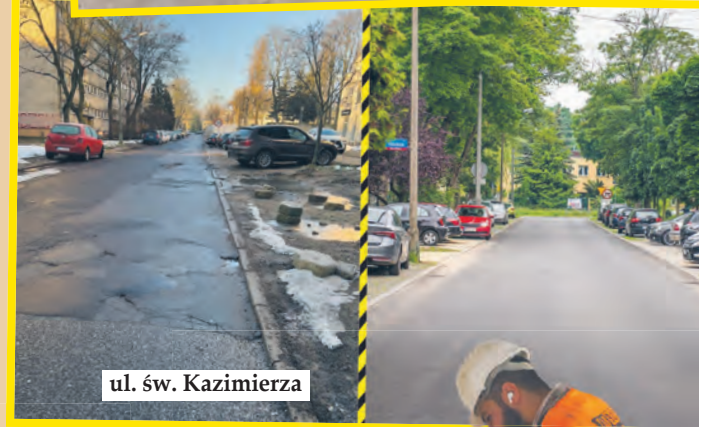
ul. św. Kazimierza