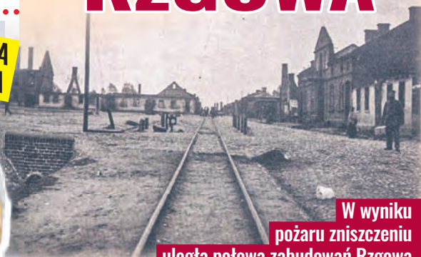
W wyniku pożaru zniszczeniu uległa połowa zabudowań Rzgowa