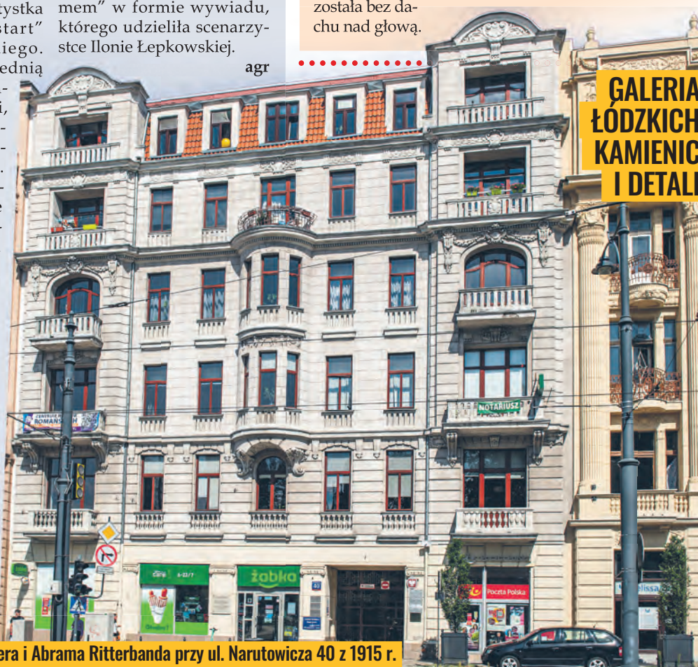
GALERIA ŁÓDZKICH KAMIENIC I DETALI