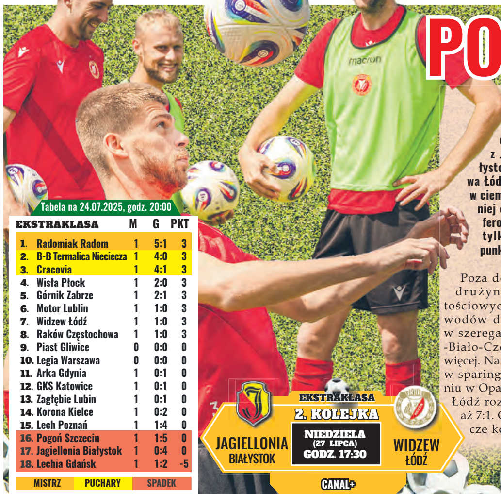
Tabela na 24.07.2025, godz. 20:00