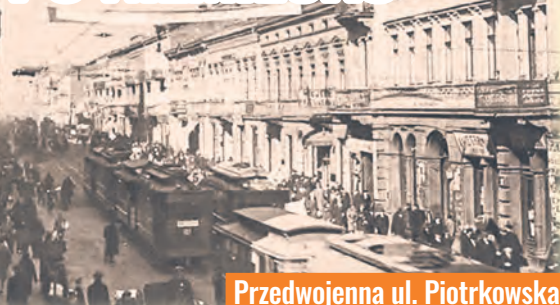
Przedwojenna ul. Piotrkowska