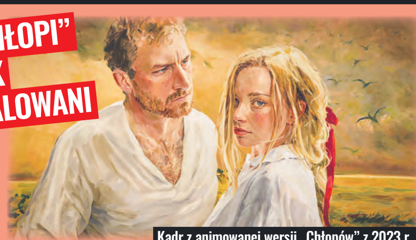
Kadr z animowanej wersji „Chłopów” z 2023 r.

dat do rywalizacji o Oscara dla najlepszego pełnometrażowego filmu międzynarodowego, lecz nie zdobył nominacji.