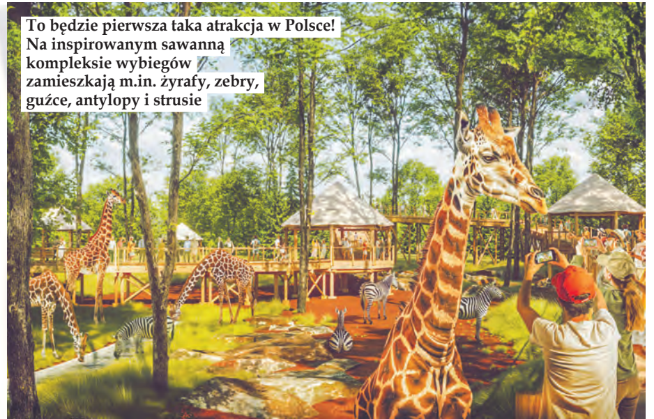
To będzie pierwsza taka atrakcja w Polsce! Na inspirowanym sawanną kompleksie wybiegów zamieszkają m.in. żyrafy, zebry, guźce, antylopy i strusie

zwierzęta z wyjątkowej perspektywy. Tak blisko żyrafy w Łodzi nikt jeszcze nie był! Nowe wybiegi powstaną w miejscu dziewięciu obecnych – zostaną one połączone i zaaranżowane tak, by jak najwierniej odwzorować naturalne środowisko zwierząt. Atrak-