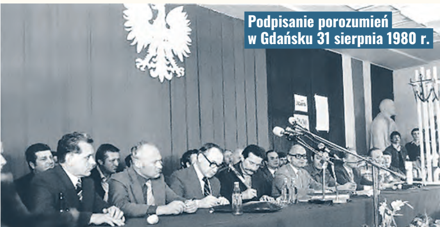
Podpisanie porozumień w Gdańsku 31 sierpnia 1980 r.

Umieszczenie przez szereg łódzkich zakładów w swoich żądaniach 21 postulatów z porozumień w Gdańsku było bardzo ważne dla tworzącego się ruchu związkowego. W kilku innych województwach strajki o poprawę warunków bytowych oraz walki o NSZZ trwały niemal do końca września.