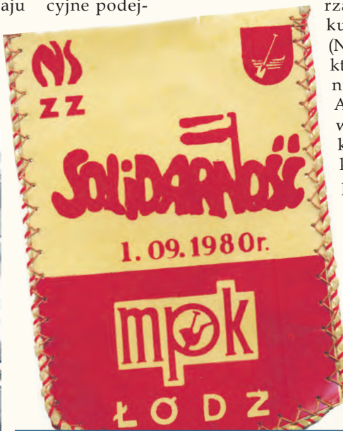
W zajezdni MPK przy ul. Tramwajowej ulokował się Komitet Założycielski NSZZ. Pamiątkowy proporczyk z 1980 r.