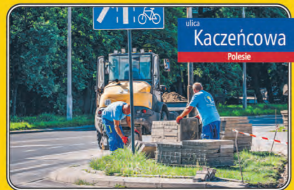
ulica Kaczeńcowa Polesie