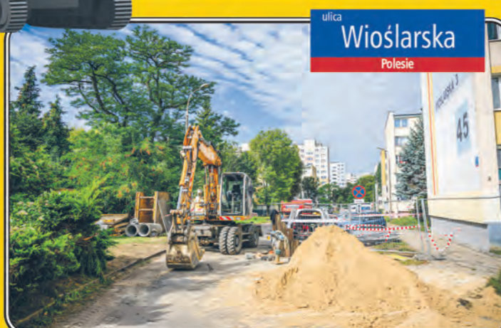
ulica Wioślarska Polesie