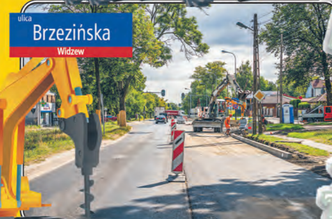
ulica Brzezińska Widzewie