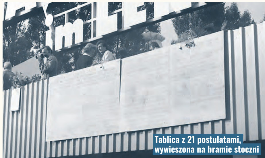
Tablica z 21 postulatami, wywieszona na bramie stoczni

Porozumienia sierpniowe z Gdańska i Szczecina stały się sukcesem protestujących w całym kraju ludzi. Po zakończeniu strajków przystąpiono przede wszystkim do zrealizowania najważniejszego chyba