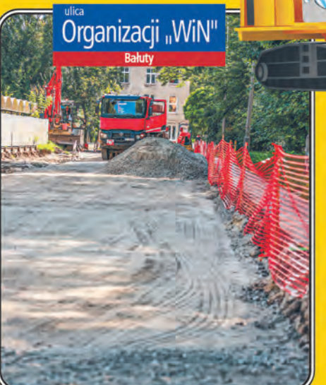
ulica Organizacji 'WiN' Bałuty