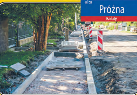
ulica Prózna Bałuty