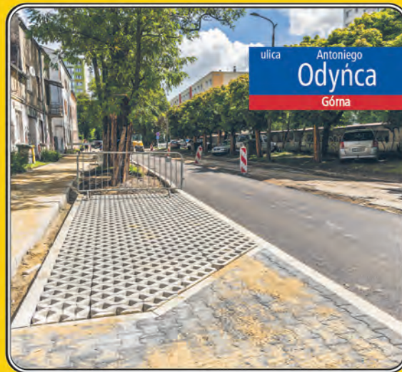
ulica Antoniego Odyńca Górnym