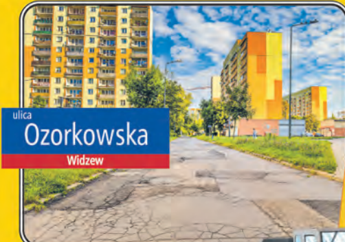
ulica Ozorkowska Widzewie