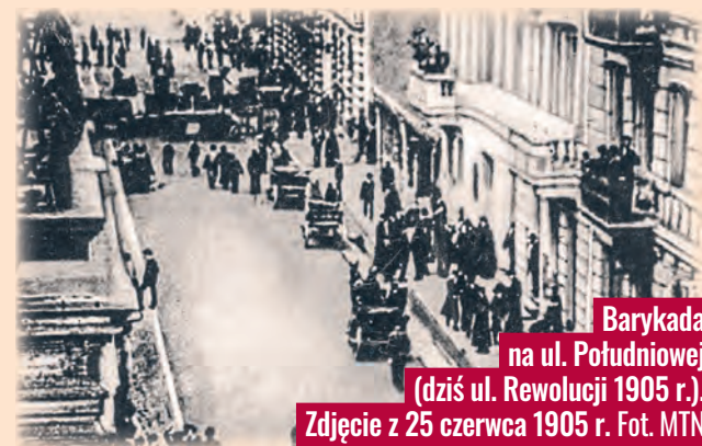
Barykada na ul. Południowej (dziś ul. Rewolucji 1905 r.). Zdjęcie z 25 czerwca 1905 r.

ŁÓDŹ.pl DLA SENIORA | DLA RODZIN | DLA KOCHAJĄCYCH ŁÓDŹ