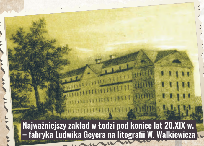
Najważniejszy zakład w Łodzi pod koniec lat 20. XIX w. – fabryka Ludwika Geyera na litografii W. Walkiewicza