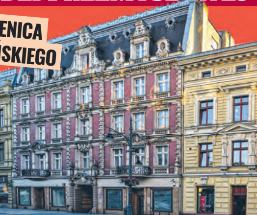
Kamienica Poznańskiego przy ul. Piotrkowskiej 51