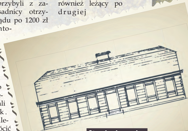
Standardowy plan drewnianego domu w Łódce

ul. Piotrkowskiej, drugą urządzono w rejonie ul. Czerwonej. Geyer zajmował początkowo tylko plac po południowej stronie stawu, później zaś objął również leżący po drugiej