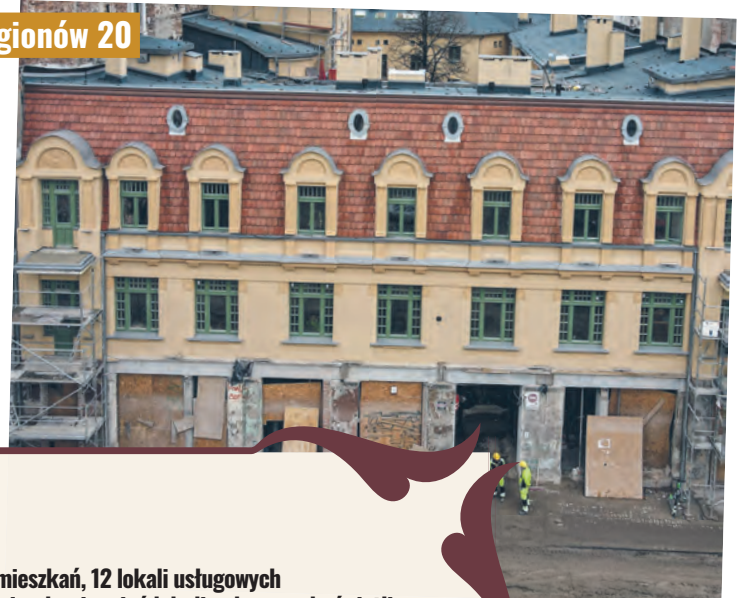
ul. Legionów 20

remonty budynków i przestrzeni publicznych są najbardziej efektywne – najważniejsze jest przezwyciężenie kryzysu społecznego. Rewitalizacja jest długim procesem. Jej powodzenie zależy od wszystkich – mieszkańców całego miasta, przedsiębiorców, organizacji pozarządowych, placówek