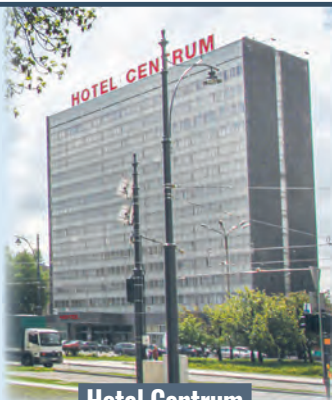
Hotel Centrum tuż przed rozbiórką

26 czerwca 2014 r. łódzki Hotel Centrum przyjął ostatnich gości, a następnego dnia został zamknięty. Hotel funkcjonował w Łodzi w latach 1976–2014 przy ul. Kilińskiego 59–63. Zlokalizowany był w samym centrum, niemal na wylocie z dworca Łódź Fabryczna, niedaleko ul. Piotrkowskiej, i stanowił w czasach PRL swego rodzaju wizytówkę miasta. Prezentowany był nawet na pocztówkach. W Hotelu Centrum było 188 pokoi, siedem sal konferencyjnych, restauracja, kasyno i mały basen.