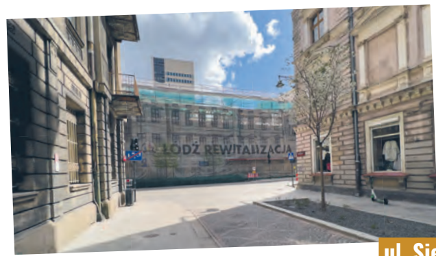
ul. Sienkiewicza 22