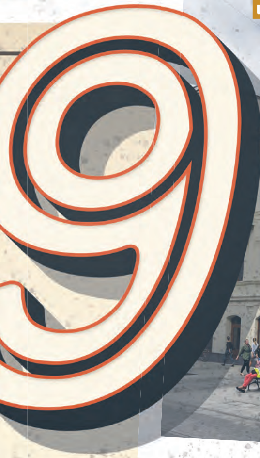
ul. Piotrkowska 118