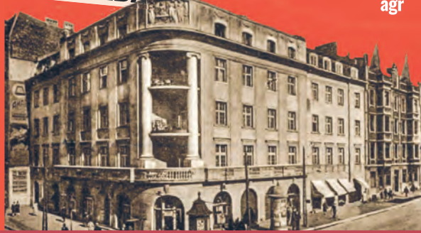
Kamienica Poznańskich przy ul. Legionów 32 na starej pocztówce

bogato dekorowana, pięciokondygnacyjna kamienica rodziny Poznańskich, wybudowana na początku XX w. agr