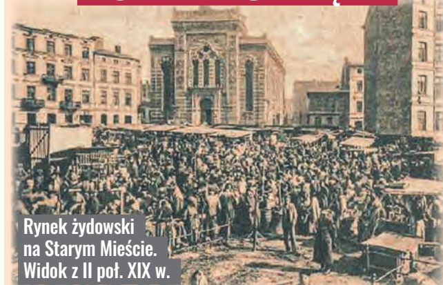
Rynek żydowski na Starym Mieście. Widok z II poł. XIX w.