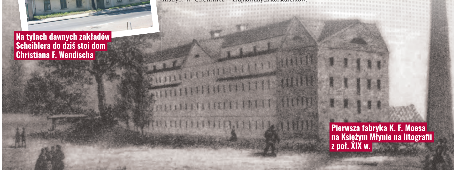
Pierwsza fabryka K. F. Moesa na Księżym Młynie na litografii z poł. XIX w.