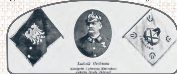
Ludwik Grohman – twórca i komendant Łódzkiej Straży Ogniowej

w przedziałnictwie bawełny. Zakłady Geyera, Grohmana, Landego i Moesa wytwarzały w połowie XIX w. 2/3 produkcji okrę-