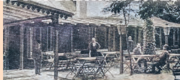
Ogródek restauracyjny w Paradyżu (dziś ul. Piotrkowska 175)