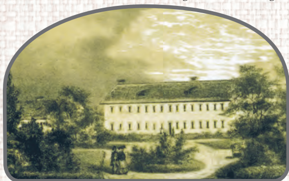
Pierwszy zakład Traugotta Grohmana w posiadle Lamus z lat 40. XIX w.

Na gruntach, należących do zdewastowanego młyna, stary Grohman wystawił jednopiętrowy gmach fabryczny i sześć budynków mieszkalnych dla robotników. Fabryka posiadała przedziałnię z ośmioma maszynami i 2400 wrzecionami oraz 60 warsztatów tkackich bawełny. Budynki były murowane, kryte dachówką. Dookoła powstał ogród. Całe posiadło nabył potem Grohman na własność, „aby miasto upiększyć, sztachetami zagrozić i drzewa posadzić”. Wystawił na początek nieduży, zachowany do dziś dom przy ul. Tylnej. W połowie lat 40. XIX w.