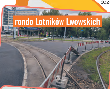
rondo Lotników Lwowskich