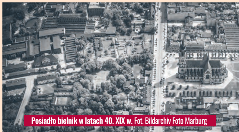
Posiadło bielnik w latach 40. XIX w.