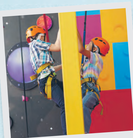
Świętowanie i wspinanie