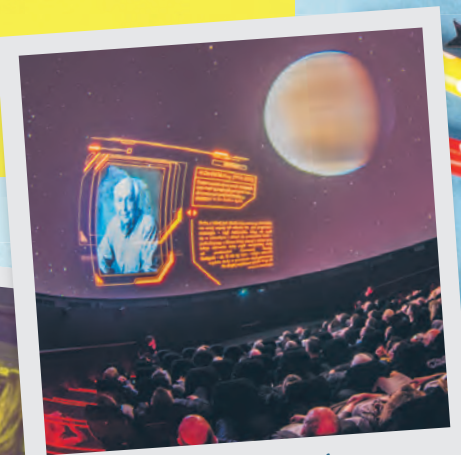
Astronomiczne gry i zabawy