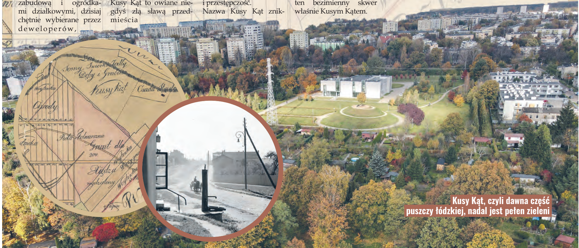
Kusy Kąt, czyli dawna część puszczy łódzkiej, nadal jest pełen zieleni