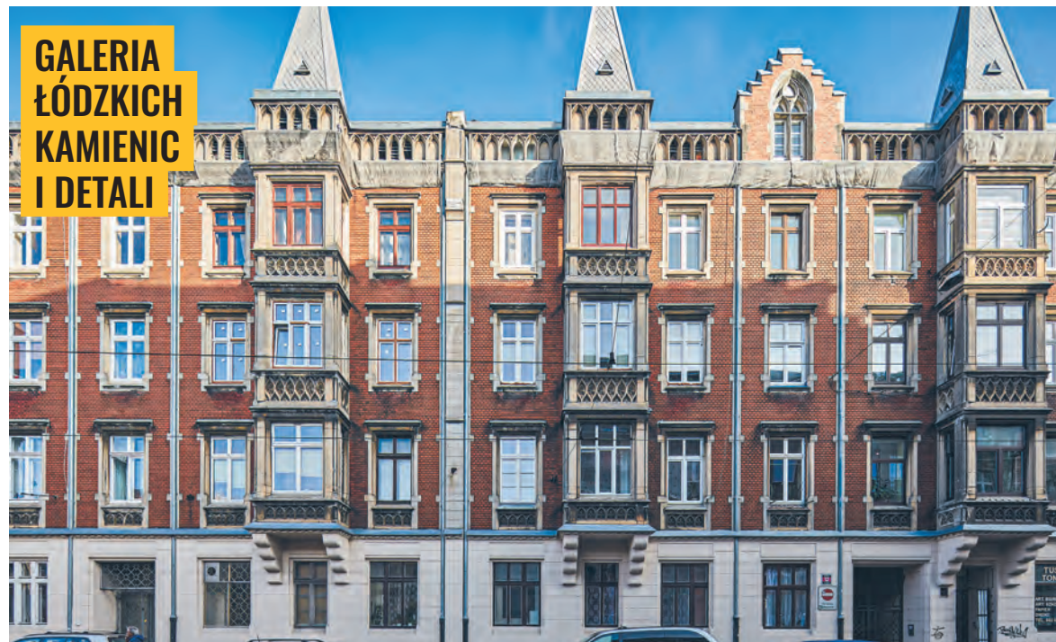
Kamienica Spółki Akcyjnej Wyrobów Bawełnianych I. K. Poznański przy ul. Gdańskiej 12 zbudowana w latach 90. XIX w.