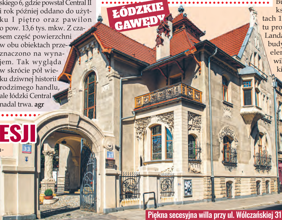
Piękna secesyjna willa przy ul. Wólczańskiej 31