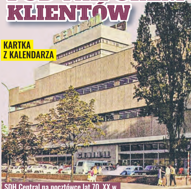
SDH Central na pocztówce lat 70. XX w.

28 sierpnia 1972 r. otwarto Spółdzielczy Dom Handlowy „Central” – jeden z oddziałów łódzkiej PSS Społem, który stał się synonimem nowoczesnego handlu.