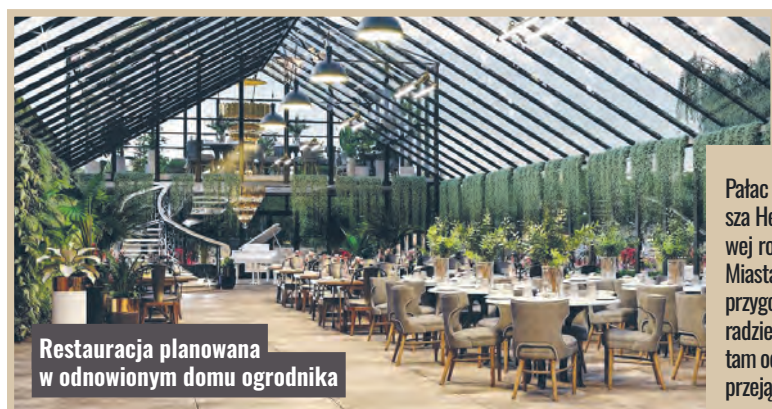
Restauracja planowana w odnowionym domu ogrodnika