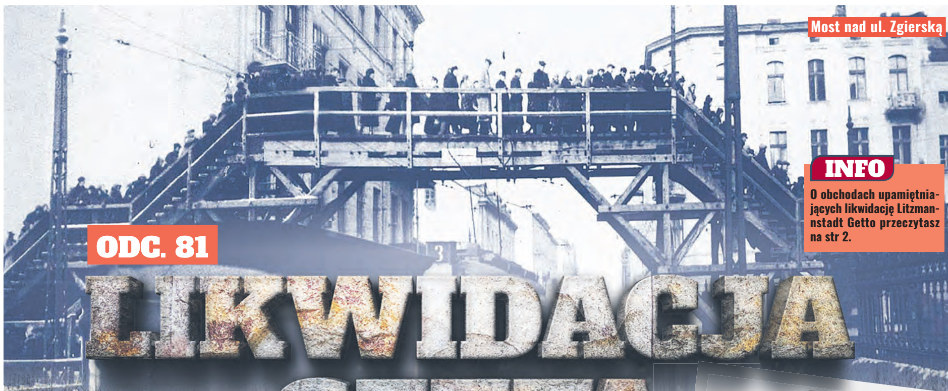
Most nad ul. Zgierską