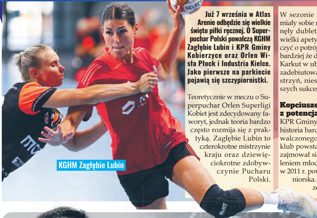
KGHM Zagłębie Lubin

Już 7 września w Atlas Arenie odbędzie się wielkie święto piłki ręcznej. O Superpuchar Polski powalczą KGHM Zagłębie Lubin i KPR Gminy Kobierzyce oraz Orlen Wiśla Płock i Industria Kielce. Jako pierwsze na parkiecie pojawią się szczypiornistki.