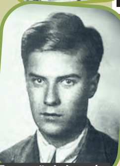
Fotografie bohaterów „Kamieni na szaniec”