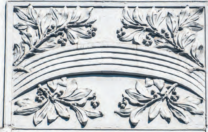
Detal architektoniczny kamienicy przy ul. Próchnika 15

ŁÓDŹ.pl DLA SENIORA | DLA RODZIN | DLA KOCHAJĄCYCH ŁÓDŹ