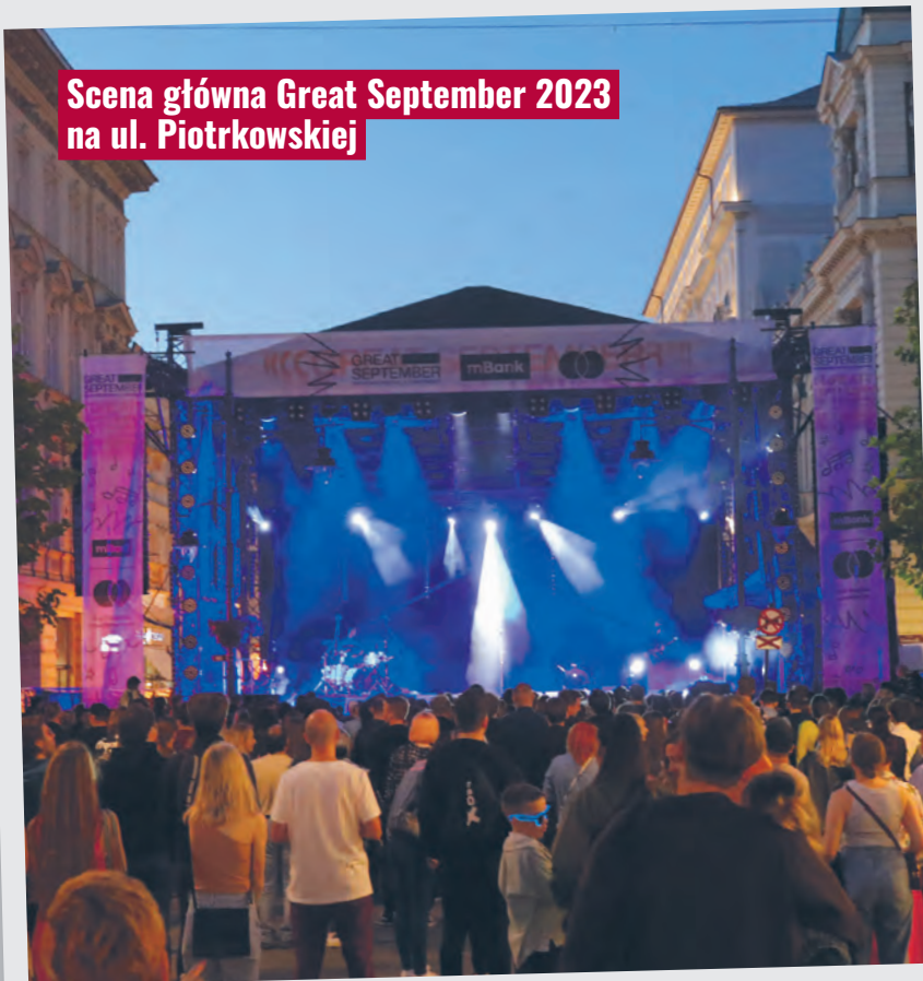
Scena główna Great September 2023 na ul. Piotrkowskiej