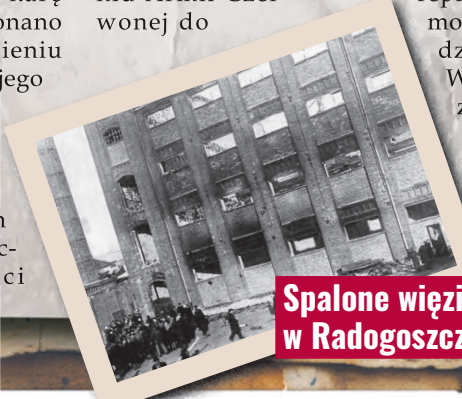
Spalone więzienie policyjne w Radogoszczu – 19 stycznia 1945 r.

kluli bagnetami chorych i funkcyjnych, później na apelu zaczęli strzelać do stojących na placu, by w końcu podpalić budynek. Z ponad 1500 uwięzionych ocalało tylko ok. 30 osób. 19 stycznia 1945 r. przed spalonym budynkiem leżały stopy zwęglonych ciał. Przez kilka tygodni trwa-