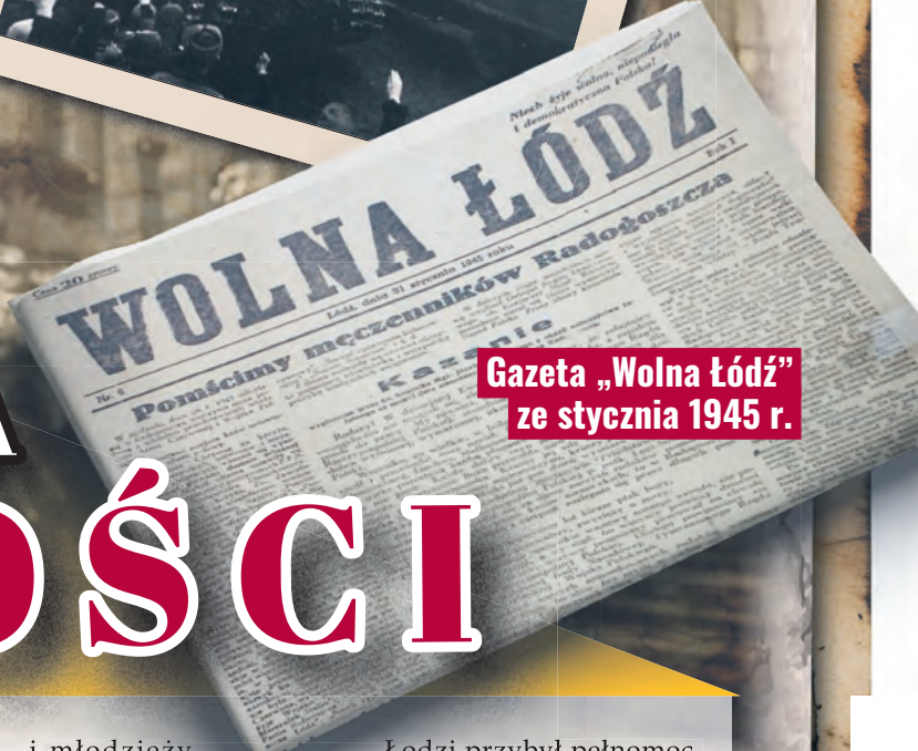
Gazeta „Wolna Łódź” ze stycznia 1945 r.

Z uwagi na bliskość frontu oraz zbliżające się oddziały Armii Czerwonej już pod koniec 1944 r. i z początkiem 1945 r. rozpoczęła się masowa ucieczka Niemców z Łodzi. Okupanci demontowali także urzędnictwo w fabrykach i wywozili je w głąb Rzeszy. Planowano również zaminowanie obiektów przemysłowych.