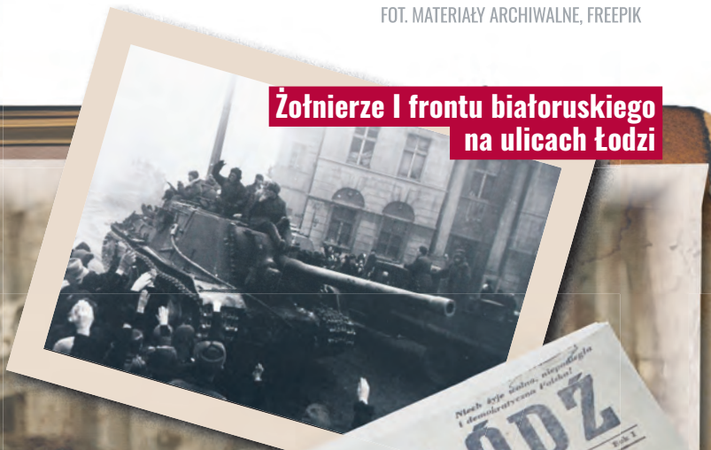
Żołnierze I frontu białoruskiego na ulicach Łodzi