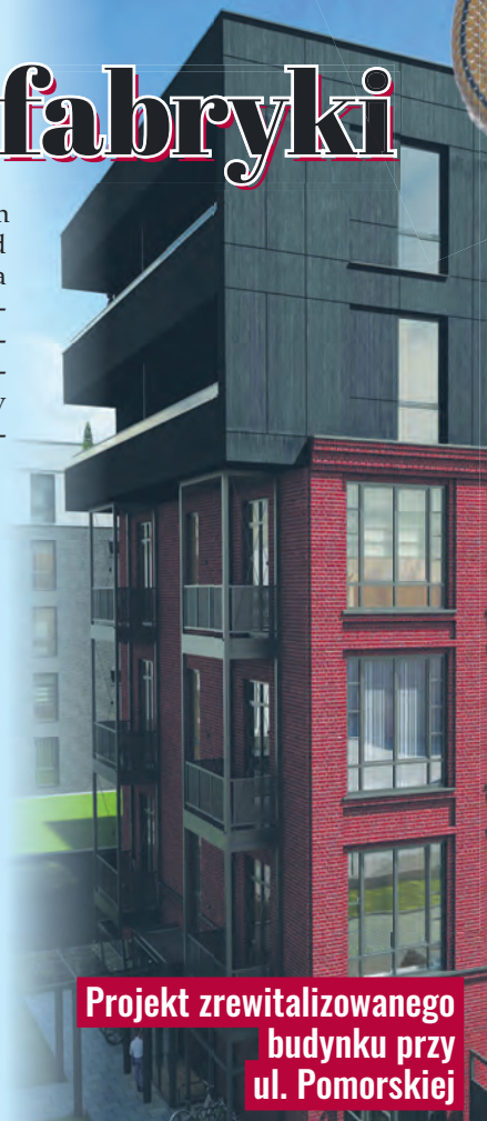
Projekt zrewitalizowanego budynku przy ul. Pomorskiej