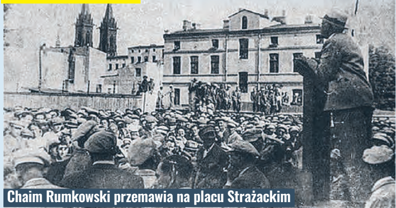
Chaim Rumkowski przemawia na placu Strażackim