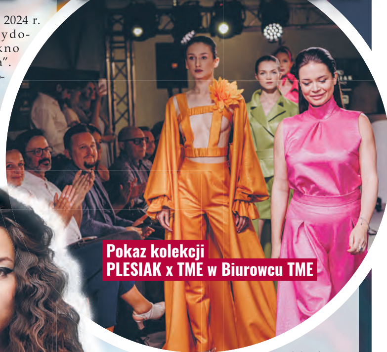
Pokaz kolekcji PLESIAK x TME w Biurowcu TME

Kolekcje prezentowane w Mediolanie i Nowym Jorku pojawią się w sesjach zdjęciowych w trakcie jego realizacji. Firma jest