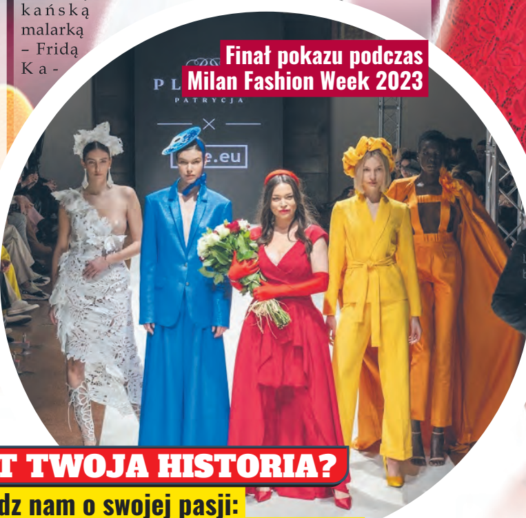
Finale pokazu podczas Milan Fashion Week 2023