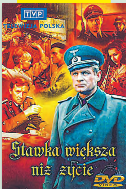
Plakat serialu – okładka płyty DVD

(Andrzej Wójtowicz), a także świetnie zagranych, wyrazistych postaciach – kapitana Hansa Klossa (agent J-23) i oficera SS Hermanna Brunnera (Emil Karewicz). Od stycznia 1965 r. do lutego 1967 r. TVP emitowała na żywo serię 14 spektakli Teatru Sensacji, ale na fali rosnącej popularności postanowiono stworzyć wysokobudżetowy serial, który został wyprodukowa-