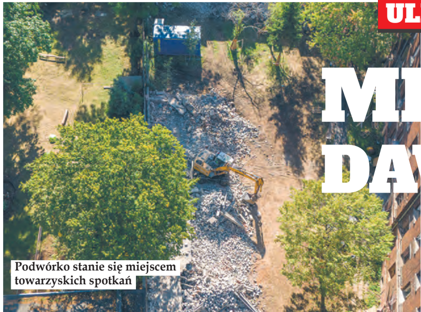
Podwórko stanie się miejscem towarzyskich spotkań

Kompleks charakterystycznych, ceglanych famuł przy ul. Ogrodowej 24 jest na pierwszym etapie gruntownej przebudowy. Obiekt, który zachowa swój historyczny charakter, będzie pełnił funkcję „mixed-use”, co oznacza, że znajdują się w nim jednocześnie mieszkania, biura i usługi. Zaglądamy na plac budowy.