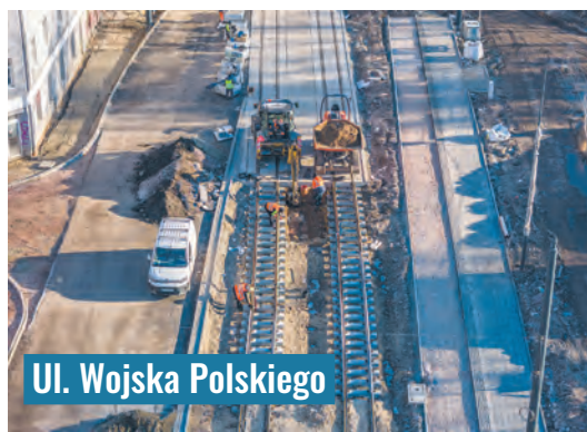
Ul. Wojska Polskiego

Urząd Marszałkowski zwerifikował nie tylko czas, ale także wysokość dofinansowania, które miasto dostanie na realizację wymienionych inwestycji. W przypadku ul. Konstantinowskiej będzie ono o 7,3 mln zł niższe, a na ul. Przybyszewskiego z wiadukta miasto dostanie 18 mln zł mniej. Zwiększone zostało natomiast unijne wsparcie na przebudowę ul. Wojska Polskiego, o prawie 9 mln zł oraz dla programu rewitalizacji, o prawie 54 mln zł. W ogólnym bilansie miasto dostanie więc 71,7 mln zł dofinansowania więcej. Pieniądze zostały już wpisane do budżetu.