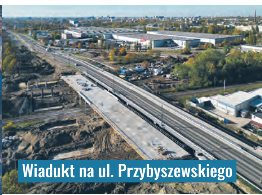
Wiadukt na ul. Przybyszewskiego