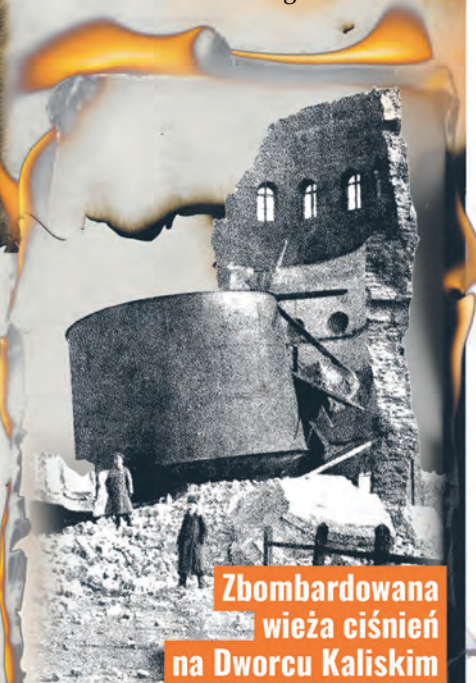
Zbombardowana wieża ciśnieniowa na Dworcu Kaliskim

Do dziś pozostał największy cmentarz wojenny na tzw. Grobowej Górze w Starej Gadce z kamiennymi nagrobkami i płytami upamiętniającymi bitwę w 1914 r.