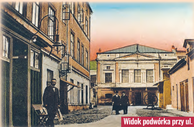
Widok podwórka przy ul. Piotrkowskiej 67 z końca XIX w.