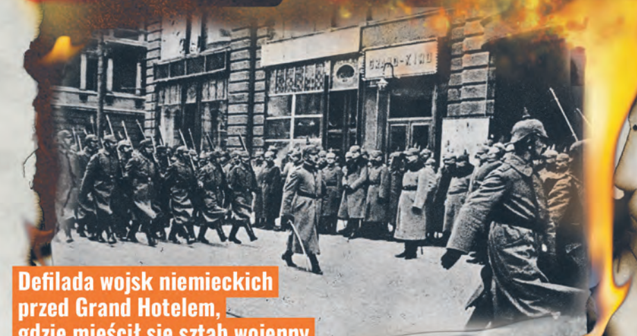
Defilada wojsk niemieckich przed Grand Hotelem, gdzie mieścił się sztab wojenny

Punkt zborny dla rezerwistów zorganizowano w parku Źródlińska. Do wojska rosyjskiego powołano w Łodzi ok. 15 tys. mężczyzn. Wszystkie fabryki stanęły. Łodzianie oblegli banki, podejmując oszczędności. 3 sierpnia dotarły wieści o bestialskim zbombardowaniu Kalisza przez Niemców. Z jednej strony cieszą się, że zaborcy rosyjscy opuścili miasto, z drugiej jednak nie było sympatii wobec Niemców. Przez kilka tygodni, na zmianę oddziały rosyjskie wycofywały się z Łodzi, a niemieckie dwukrotnie wkraczały miasta. Sytuacja była trudna, funkcję magistratu przejął utworzony 10 sierpnia Główny Komitet Obywatelski. Liczba mieszkańców pozbawionych środków do życia sięgała 135 tys. Głodowe zapomogi, wynoszące średnio 7 kopiejek na osobę dziennie, były