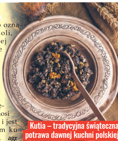
Kutia – tradycyjna świąteczna potrawa dawnej kuchni polskiej

snku, będącego oznaką zdrowia, soli, symbolizującej obfitość, a także miodu, dającego szczęście. Pierwszy dzień świąt związany jest z narodzeniem Jezusa i pokłonem mędrców, a drugi nosi nazwę synaksy i jest zgromadzeniem ku czci Matki Bożej. agr