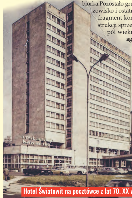
Hotel Światowit na poczłtówce z lat 70. XX w.