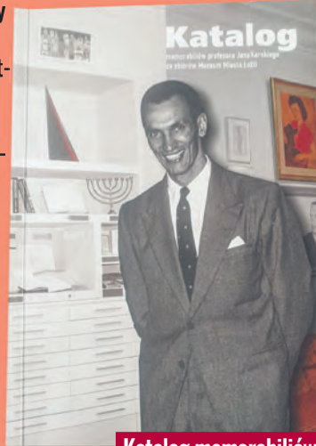
Katalog memorabliów Jana Karskiego ze zbiorów MMŁ

prasę, fotografie, nagrody, odznaczenia oraz meble z jego mieszkania w Waszyngtonie, ulubione przedmioty codziennego użytku, bibeloty i dzieła sztuki. Kilka najcenniejszych przedmiotów z tej kolekcji pokażemy na zakończenie cyklu.