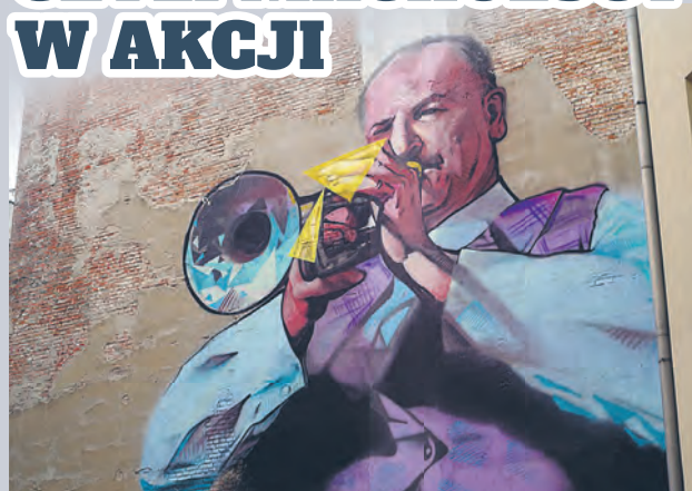
Mural przedstawiający Henryka Kwintę, bohatera filmu „Vabank”, w podwórzu kamienicy przy ul. Piramowicza 6

Festiwalu Szkół Teatralnych, pomysłodawca Alei Gwiazd w Łodzi. Mąż aktorki Haliny Machulskiej i ojciec reż. Juliusza Machulskiego, który ma w dorobku wiele kasowych produkcji, takich jak „Seksmisja”, „Kingsajz”, „Deja vu”, „Kiler”, „Vinci” czy „Ile waży koń trojański?”. Jan Machulski zmarł 20 listopada 2008 r. na zawał serca w wieku 80 lat.