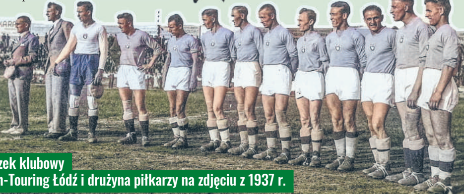
Znaczek klubowy Union-Touring Łódź i drużyna piłkarzy na zdjęciu z 1937 r.

wiąże się pewien piłkarski rekord sławnego Ernesta Wilimowskiego. W meczu rozegranym 21 maja 1939 r. zdobył on przeciwko łódzianom dzie-