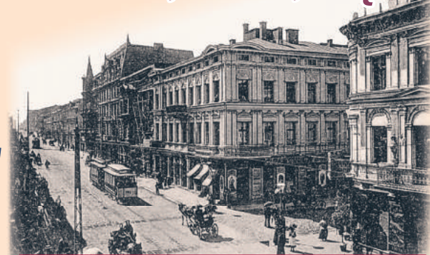
Ul. Piotrkowska od nr 45 do 53 – widok z pocz. XX w.

W Łodzi spekulacja domami i działkami budowlanymi kwitła na dużą skalę. W 1874 r. ceny gruntów przy ul. Piotrkowskiej wynosiły po 2-3 ruble za łokieć kwadratowy.