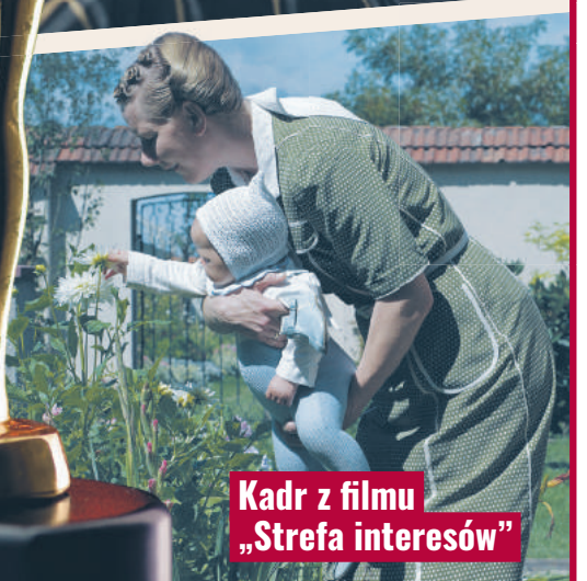
Kadr z filmu „Strefa interesów”