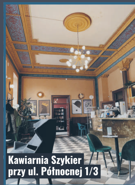
Kawiarnia Szykier przy ul. Północnej 1/3