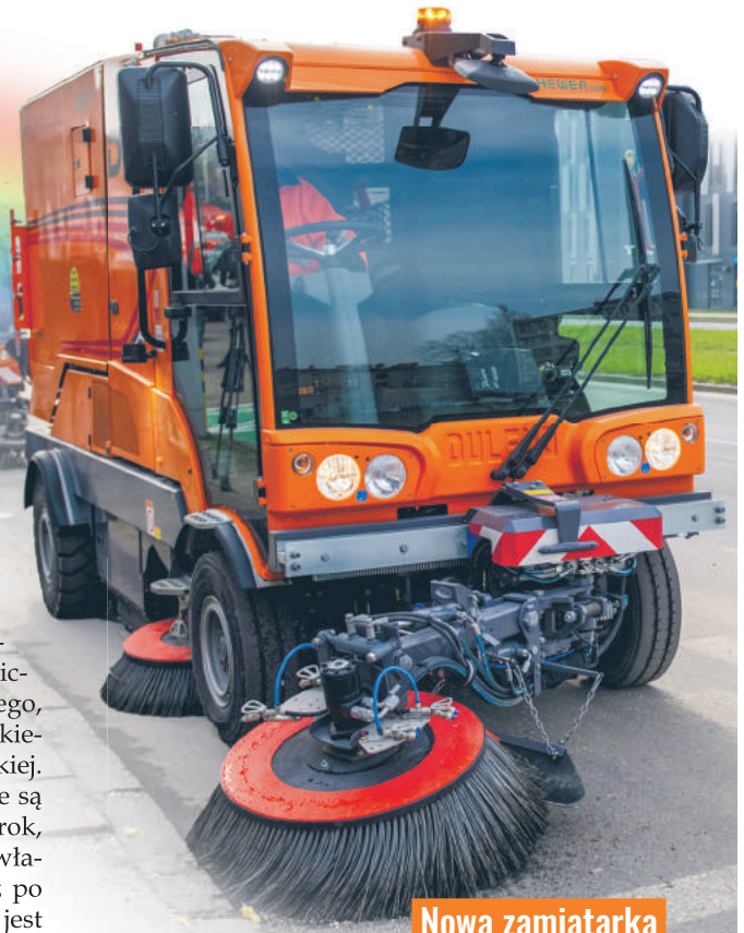
Nowa zmiatarka Łódzkiego Zakładu Usług Komunalnych