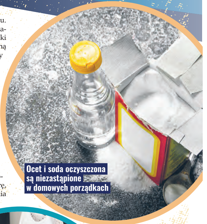
Ocet i soda oczyszczona są niezastąpione w domowych porządkach

Sprzątanie z wykorzystaniem tradycyjnych sposobów jest trendy. Przekonało się do tego wiele osób z młodego pokolenia. Solą, tak jak kiedyś, usuwają osad z kawy i herbaty lub czyszczą przypalone garnki. Z pomocą octu myją armaturę, szyby i lustra. Do prania białych ubrań, czyszczenia piekar-