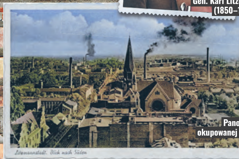
Panorama okupowanej Łodzi