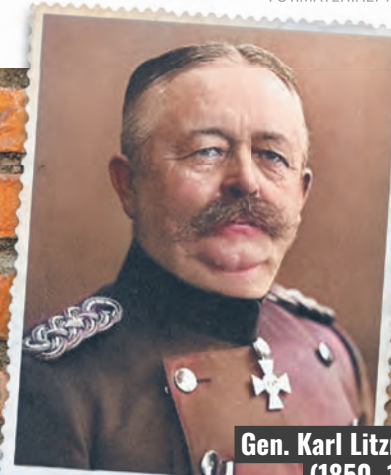
Gen. Karl Litzmann (1850–1936)