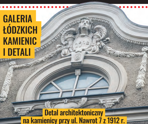
Detal architektoniczny na kamienicy przy ul. Nawrot 7 z 1912 r.

W 1904 r. prezydent Piętkowski pisał do gubernatora piotrkowskiego, że z powodu zastoju w fabrykach tysiące robotników pozostaje