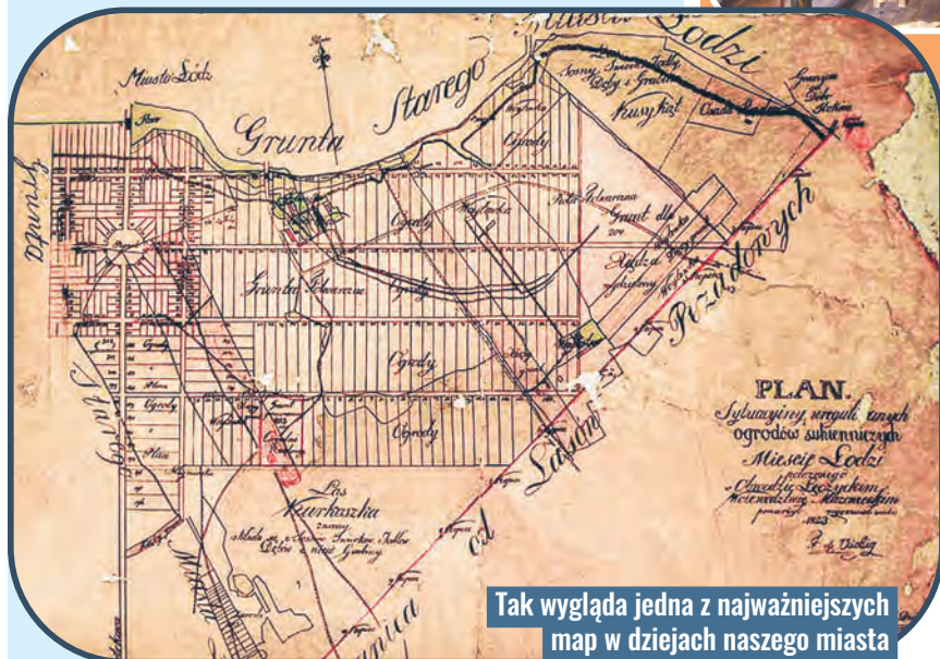
Tak wygląda jedna z najważniejszych map w dziejach naszego miasta