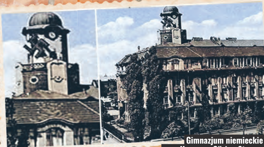
Gimnazjum niemieckie przy Hermann Göring Strasse (obecnie al. Kościuszki)