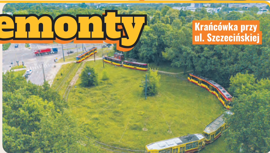
Krańcówka przy ul. Szczecińskiej