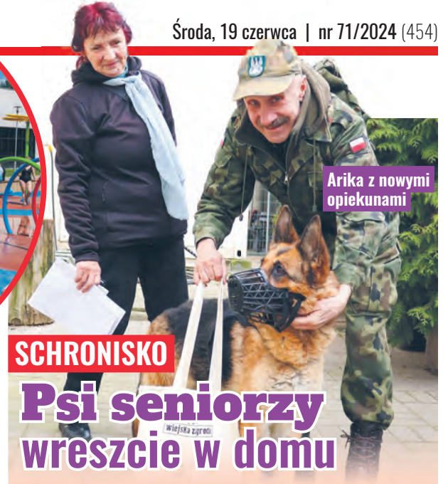
Arika z nowymi opiekunami