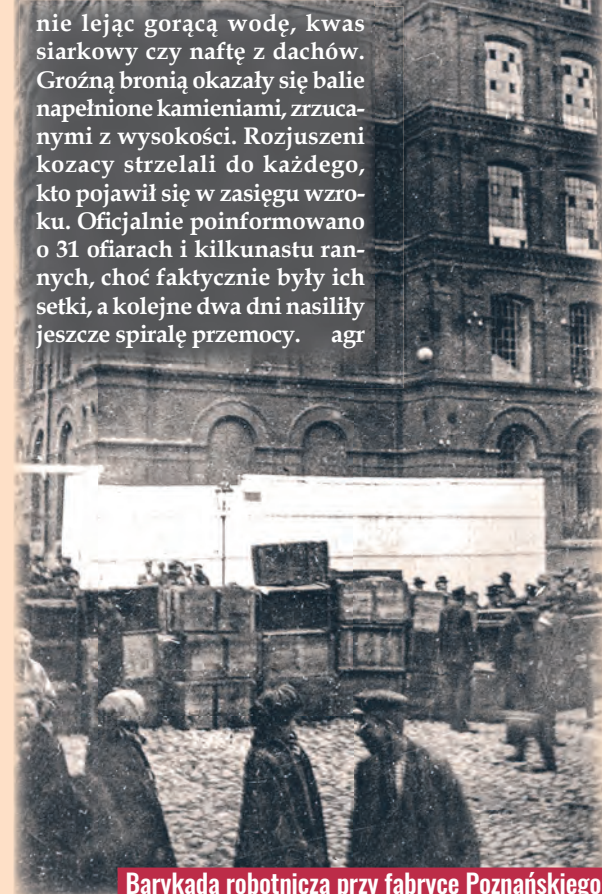
Barykada robotnicza przy fabryce Poznańskiego

nie lejąc gorącą wodę, kwas siarkowy czy naftę z dachów. Groźną bronią okazały się balie napełnione kamieniami, zrzuconymi z wysokości. Rozjuszeni kozacy strzelali do każdego, kto pojawił się w zasięgu wzroku. Oficjalnie poinformowano o 31 ofiarach i kilkunastu rannych, choć faktycznie były ich setki, a kolejne dwa dni nasiliły jeszcze spirale przemocy. agr