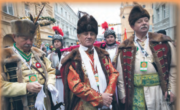
W 1994 r. reaktywowano ŁTS Bractwo Kurkowe, które świętuje w tym roku swoje 200-letnie tradycje

Już od rana tłumy gromadziły się na ul. Piotrkowskiej, aby zobaczyć barwny pochód bractwa. Rozwijano chorągiew, brzmiała orkiestra i pochód ruszał na strzelnicę, gdzie w trakcie zawodów wybierano nowego króla. Strzelano do tarczy oraz w Paradyżu lub na Wodnym Rynku. agr