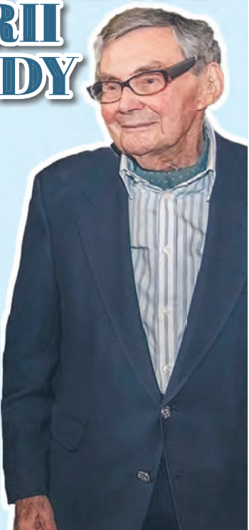
Marian Turski podczas uroczystości w dniu 10 listopada 2023 r. w pałacu Poznańskich

Po wojnie trafił do prasy. W latach 1956–1957 był zastępcą redaktora naczelnego „Sztandaru Młodych”, a od 1958 r. pracował jako kierownik działu historycznego „Polityki”. Aktywnie działał również w wielu organizacjach, m.in. jako przewodniczący zarządu Stowarzyszenia Żydowski Instytut Historyczny w Polsce, a od 2009 r. jako przewodniczący Rady Muzeum Historii Żydów Polskich Polin. W swojej działalności dał się poznać jako niezłomny świadek Holocaustu i propagator idei tolerancji. 28 stycznia 2019 r. wygłosił przemówienie w sali Zgromadzenia Ogól-