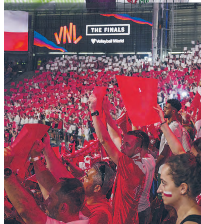
Triumfotorem Ligi Narodów została Francja, która w finale turnieju w łódzkiej Atlas Arenie pokonała w niedzielę (30 czerwca) reprezentację Japonii 3:1.