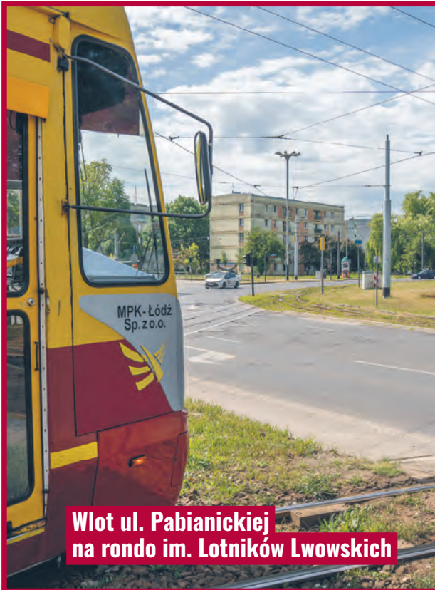
Wlot ul. Pabianickiej na rondo im. Lotników Lwowskich

Rozpoczęły się remonty torowisk tramwajowych na ul. Aleksandrowskiej i ul. Pabianickiej. Są prowadzone w wakacje, by wykorzystać czas zmniejszonego natężenia ruchu pojazdów, a tym samym zminimalizować utrudnienia, choć ich nie braknie.