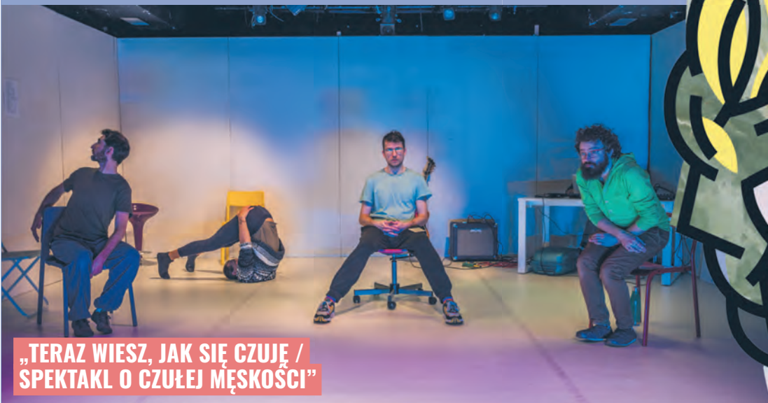
„TERAZ WIESZ, JAK SIĘ CZUJĘ / SPEKTAKL O CZUŁEJ MĘSKOŚCI”

Czy jesteśmy w stanie wybudzić się z letargu i odzyskać poczucie rzeczywistości? Jeśli tak, to jaki teatr może nam w tym pomóc? Odpowiedzi na te pytania przyniesie ma XIII edycja Międzynarodowego Festiwalu Teatralnego „Retroperspektywy” zatytułowana „Przebudzenia”.