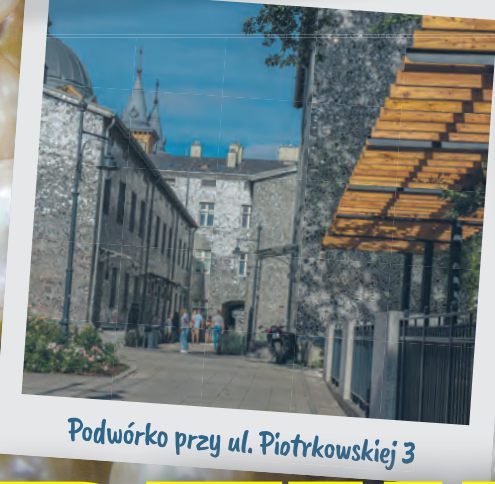
Podwórk przy ul. Piotrkowskiej 3