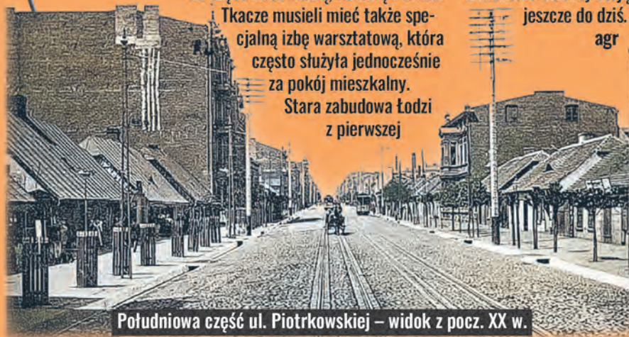
Południowa część ul. Piotrkowskiej – widok z pocz. XX w.