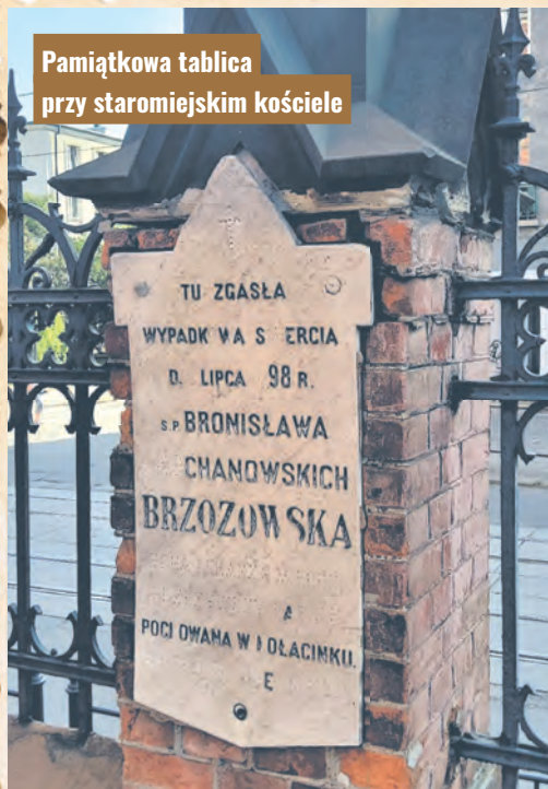
Pamiętnikowa tablica przy staromiejskim kościele