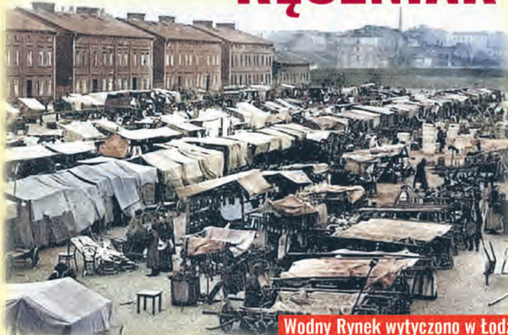
Wodny Rynek wytyczono w Łodzi ponad 180 lat temu

Można tam było kupić jakieś używane, ale nieznośne ubrania, krawaty, buty, rozmaite bibeloty, zegarki, paski, drobne sprzęty, które udało się przynieść z domu i sprzedać z ręki poza rzędami straganów. To był właściwie taki mały pchli targ funkcjonujący na przedpolu sporego handlowego placu. agr