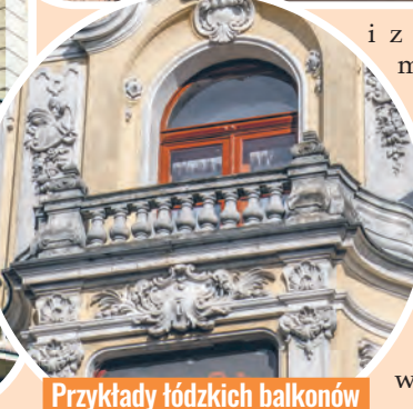
Przykłady łódzkich balkonów