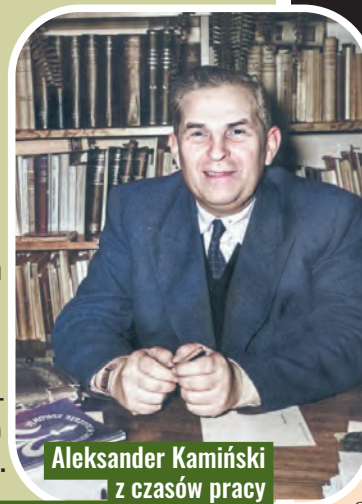
Aleksander Kamiński z czasów pracy na Uniwersytecie Łódzkim

Na początku lat 70. XX w. – na zlecenie ówczesnych władz – stworzył raport dotyczący skutków ewentualnego wprowadzenia wolnych sobót. Po przejściu na emeryturę w 1973 r. wrócił do Warszawy. Swoje naukowe rozważania zawarł w książce „Funkcje pedagogiki społecznej” (1974). W swym dorobku pozostawił prawie 240 innych prac oraz setki artykułów i recenzji.